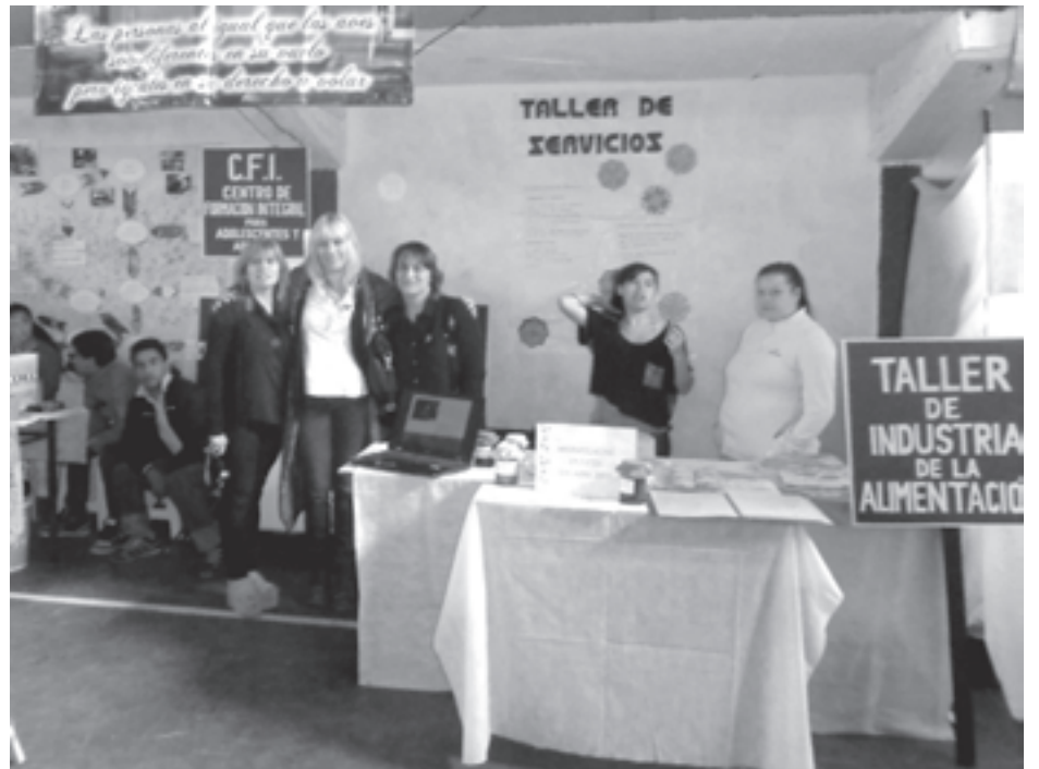
Una idea innovadora.