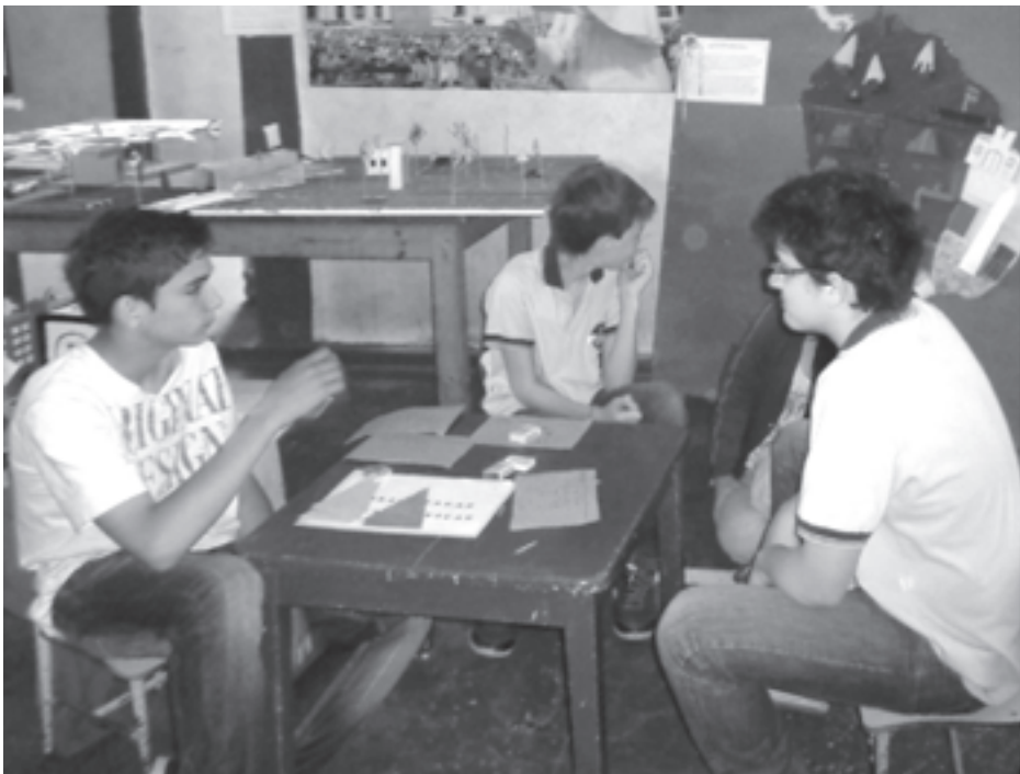
Nadie se quiso perder las Sociales de TIEMPO.

Docentes y alumnos que trabajaron conjuntamente.