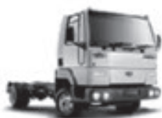
C 915 E

Cuotas fijas y en pesos. Aplicable a toda la línea cargo (**)