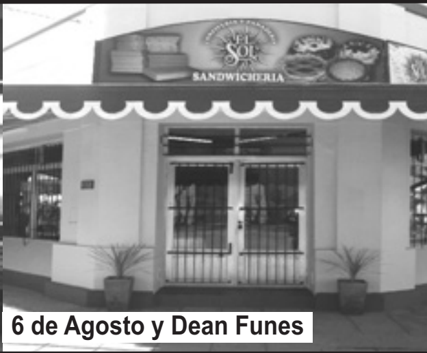
6 de Agosto y Dean Funes