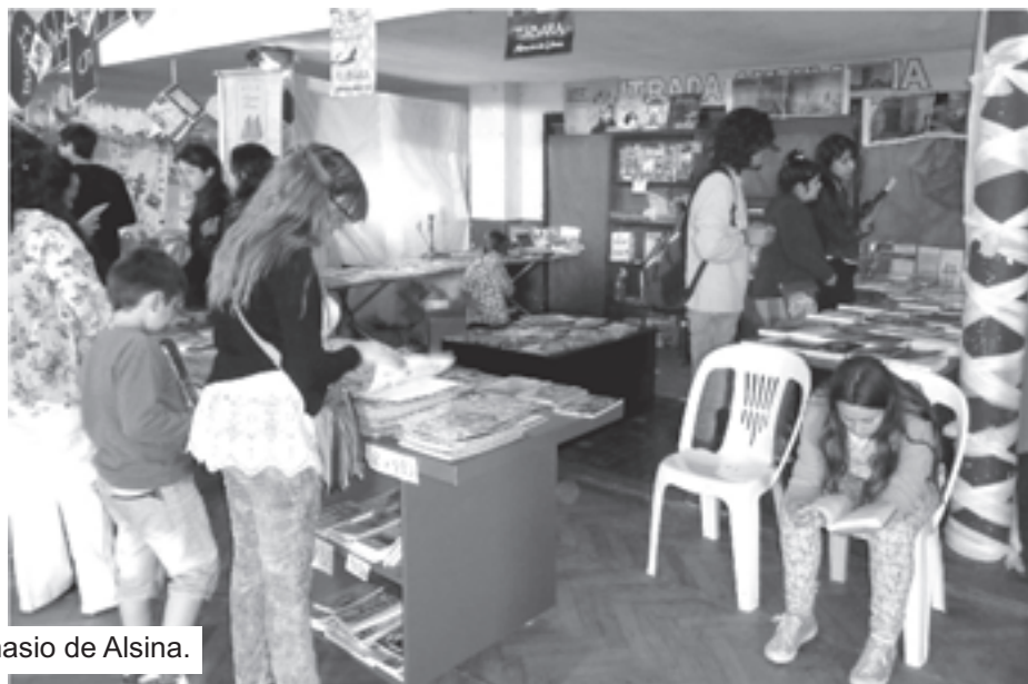
Tres días donde el público pudo acercarse a las distintas actividades en el gimnasio de Alsina.