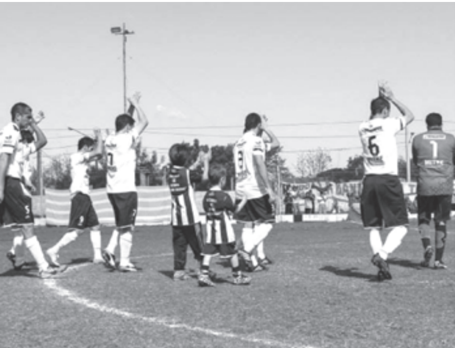
El publico Alsinista en la linda tarde de domingo.