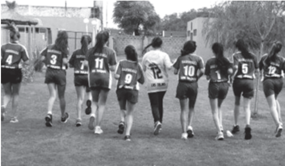
Las chicas de Handball.