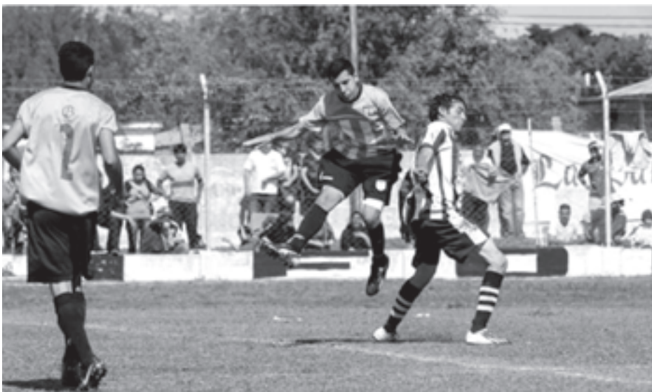
Imágenes del clásico.