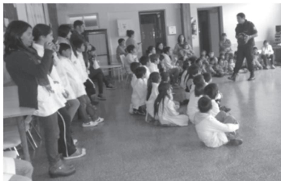
La vecina localidad recibió la obra de concientización.

UN ESPACIO DE INTERCAMBIO Y REFLEXION Inf. Pag 4.