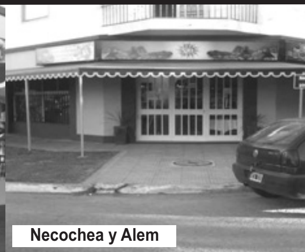
Necochea y Alem