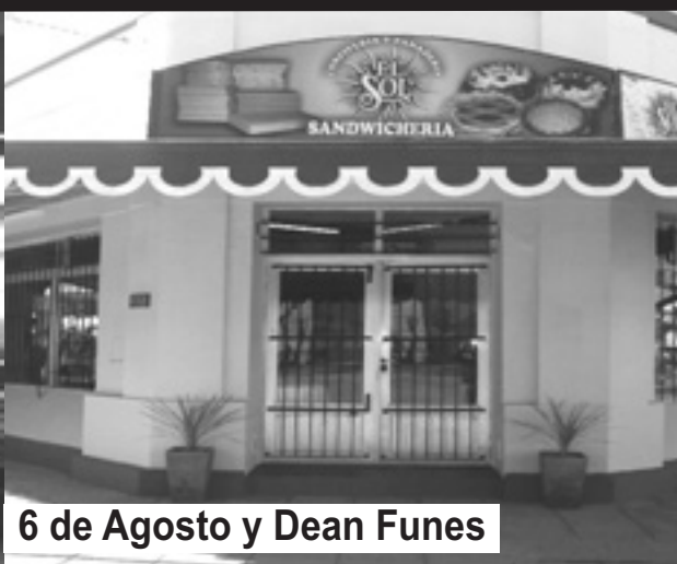
6 de Agosto y Dean Funes