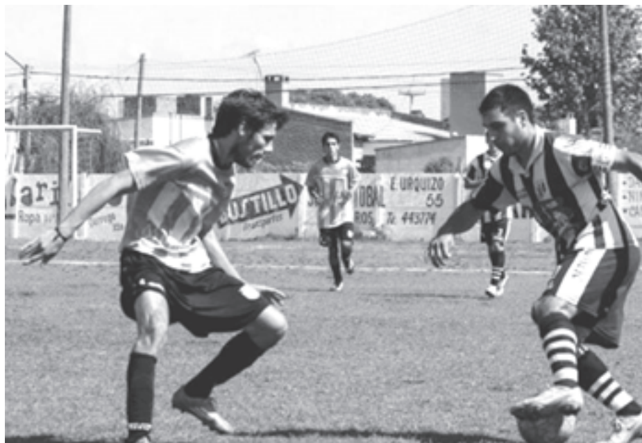
Así quedó la tabla en el arranque: Alsina 3, River y Morse 1 y cierra Viamonte con 0.