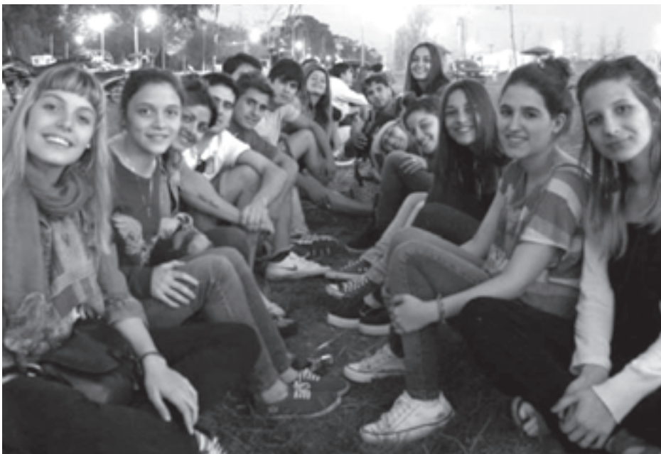
Equipo de mate, gaseosa, todo valido para disfrutar del picnic.

Las chicas disfrutando la tarde-noche del viernes.