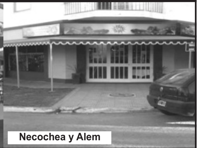
Necochea y Alem

SOCIALES - ADEMAS DEL PICNIC DE JOVENES HUBO FAMILIAS COMPLETAS QUE DISFRUTARON DE UNA JORNADA DE EXCELENTE CLIMA