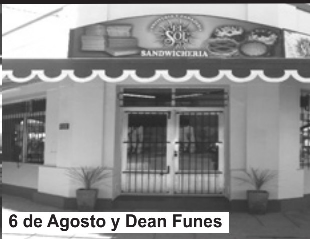
6 de Agosto y Dean Funes