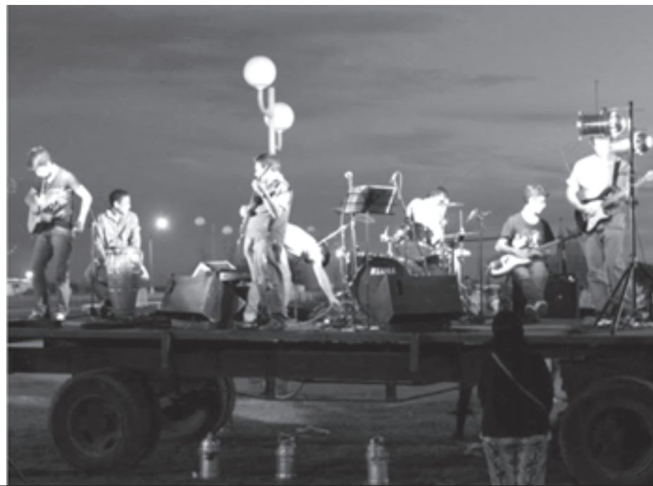
Un fin de semana ideal para festejar la llegada de la primavera.