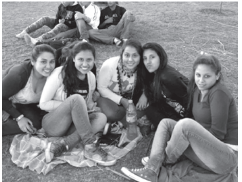
La alegría de los jóvenes.