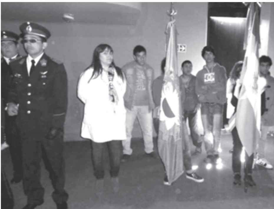
La bandera bonaerense.