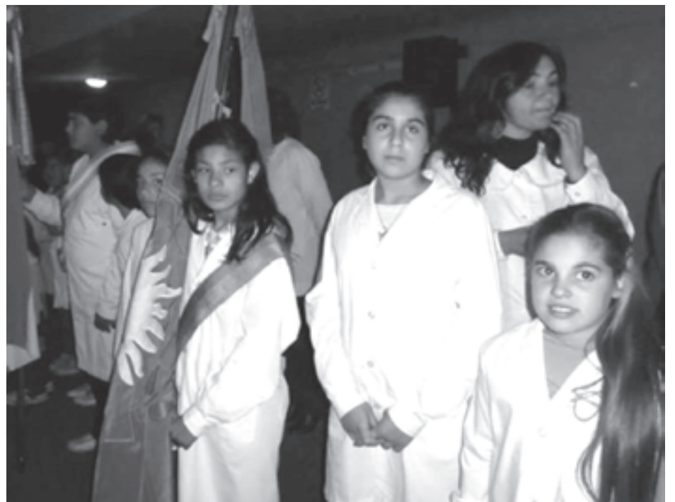
La bandera nacional.