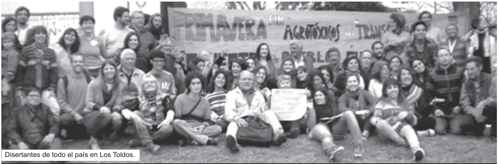
Disertantes de todo el país en Los Toldos.

EL MES DE SEPTIEMBRE DEDICADO A "ROMAN POLANSKI" HOY EL PIANISTA Inf. Pag 4.