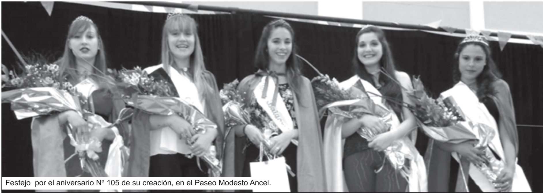
Festejo por el aniversario Nº 105 de su creación, en el Paseo Modesto Ancel.

FERIA DE VARIEDADES" SE PRESENTARA, CON ENTRADA LIBRE Y GRATUITA, EL JUEVES 18 DE SEPTIEMBRE EN EL CINE ITALIANO