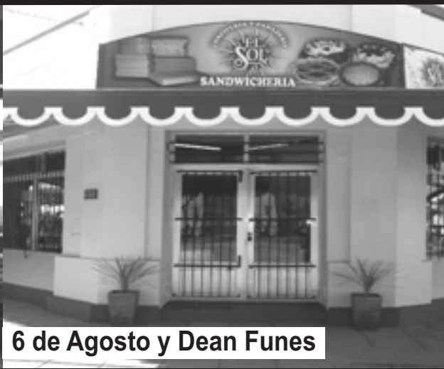
6 de Agosto y Dean Funes