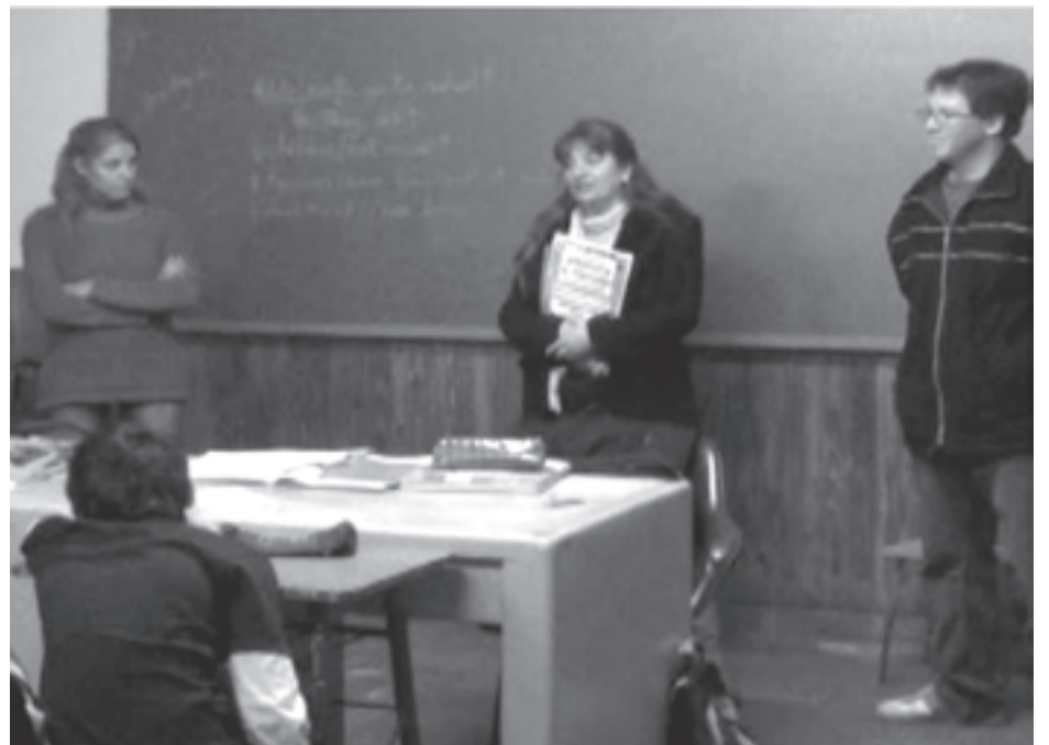
Mucha gente se acercó a disfrutar la realización en Baigorrita.