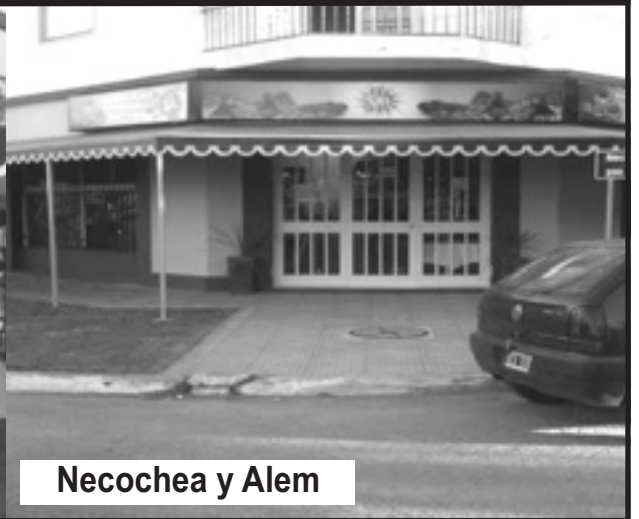
Necochea y Alem