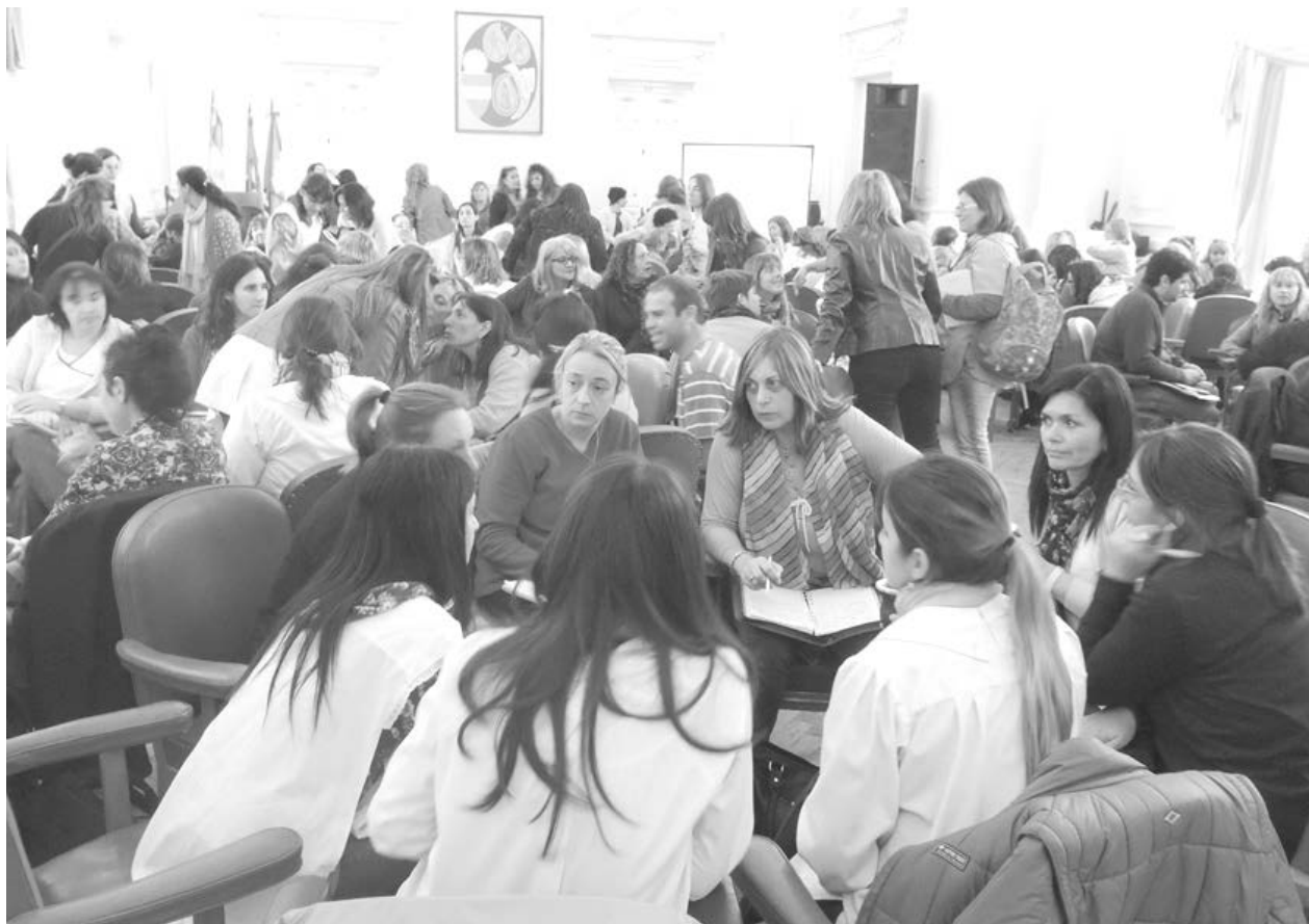
Autoridades educativas de la modalidad especial presentes en la jornada de ayer.