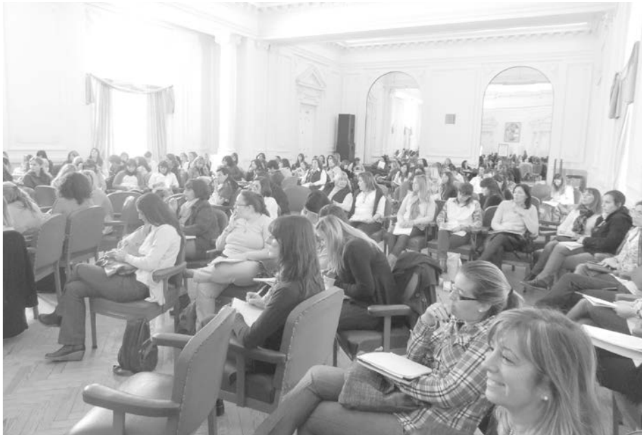
Buena participación de docentes de una amplia zona de la región.