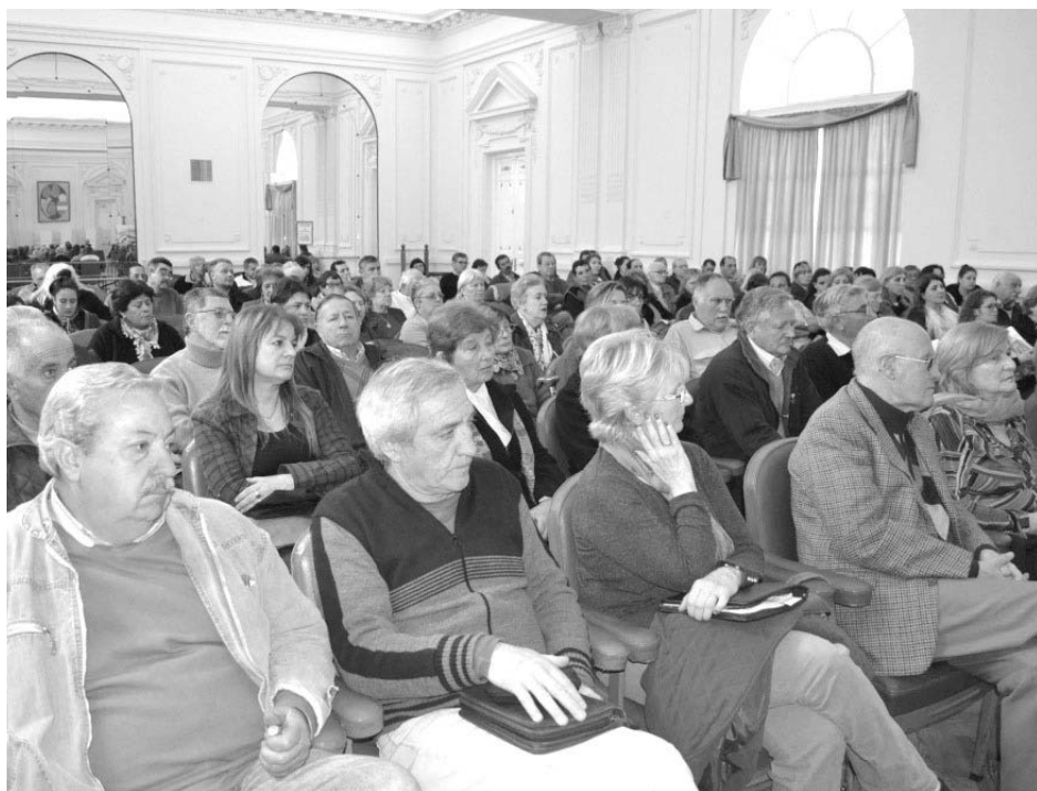
Asistentes a la jornada de intercambio realizada el pasado viernes.