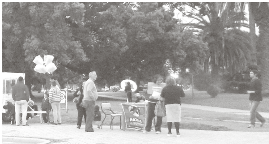
Referentes del espacio entregaron folletos a los vecinos.

"Creemos que ésta es la manera de clarificar opiniones, aún con quienes no coincidimos, propiciando el diálogo, proponiendo pensar los temas nacionales -como hemos hecho con otros anteriormente-, por lo que estamos entregando un folleto con una síntesis de la información acerca del accionar de los fondos buitres y las consecuencias