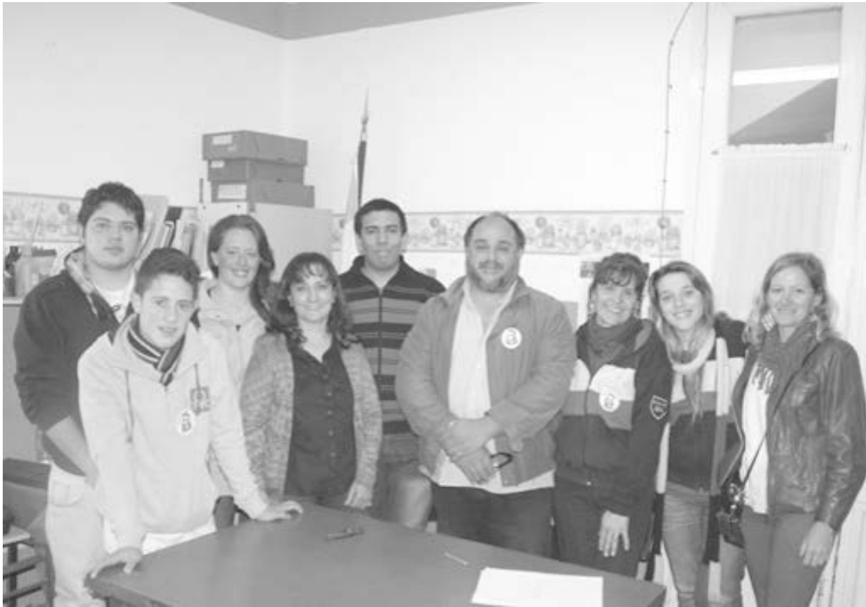
La inspectora Jefe Distrital junto a profesores y alumnos que participaron de la etapa regional de la Feria.

Por su parte, la Escuela Secundaria N° 5 de French, participó con un proyecto destinado a la ecología, para darle vida útil a los elementos en desuso, contribuyendo al reciclado. “La intención fue contagiar a la comunidad para unificar esfuerzos en juntar los residuos”, explicó una de las alumnas, indicando que “el proyecto incluye la colocación de contenedores en distintos lugares de la localidad”.