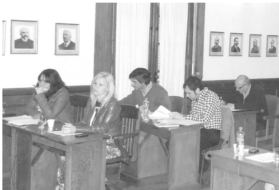
El bloque del FpV cuestionó desprolijidades del Ejecutivo.

Nuestra interlocutora enumeró también algunos de los expedientes que fueron aprobados por unanimidad en la sesión del viernes, entre los que mencionó la disposición de nueva cartelería obligatoria para las farmacias de turno; mejorando el sistema actual; la limpieza de los desagües pluviales