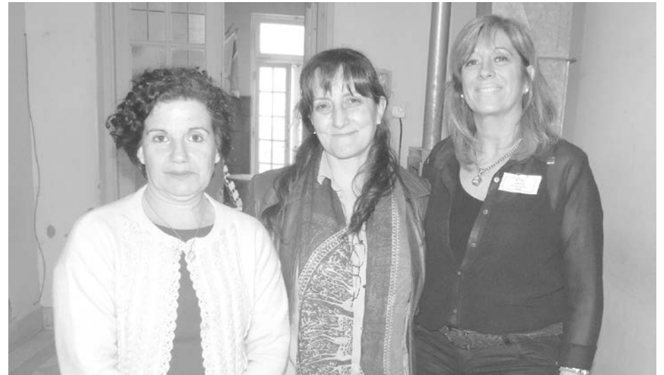
Autoridades provinciales y locales acompañaron la importante jornada.

"Este tipo de encuentros se vienen desarrollando en todo el ámbito de la provincia de Buenos Aires con el objetivo de trabajar en territorio las trayectorias educativas de los niños con discapacidad", explicó por su parte Cecilia Dalini,