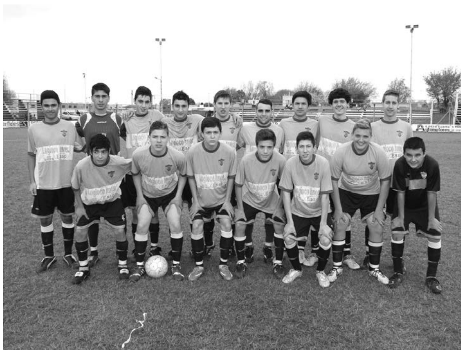
Quinta División de Atlético San Martín.