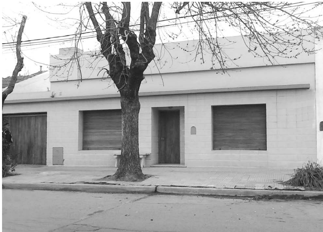
Se reiteran los robos en la ciudad sin importar la hora ni el lugar.

Sin lugar a dudas se trata de un hecho que marca claramente la problemática de inseguridad que se viene observando en los últimos tiempos en la ciudad.