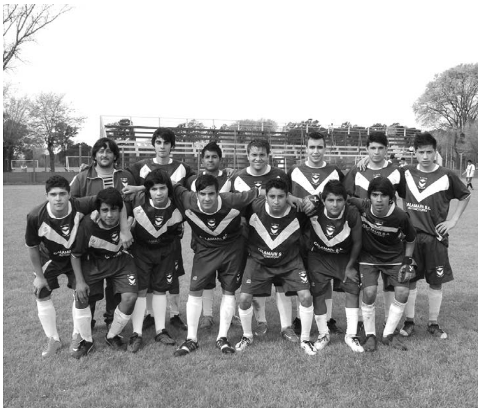
Quinta División de El Fortín.