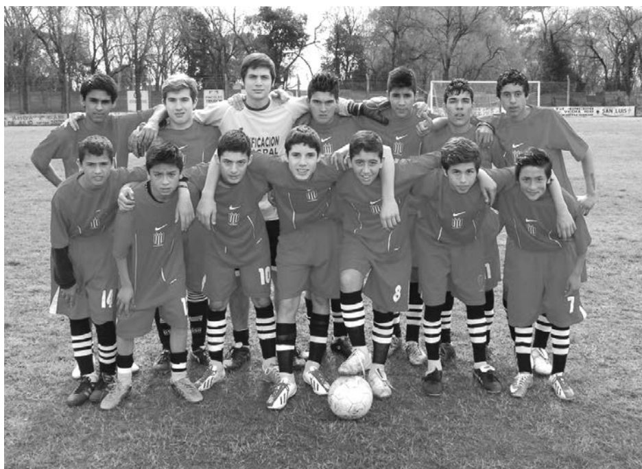
Sexta División de Atlético Dudignac.