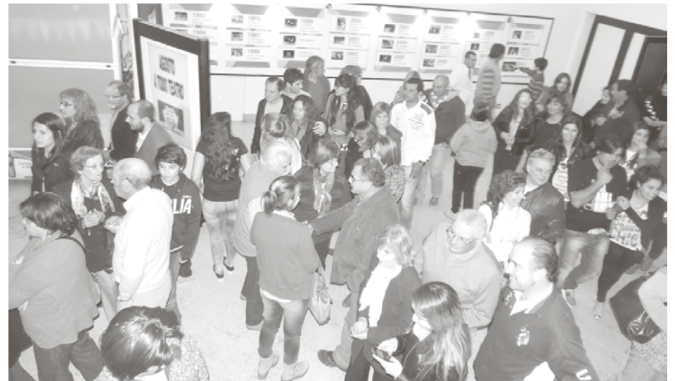
Éxito total de público de todas las funciones de la obra.

integrantes del staff, que desde el mes de febrero pasado viene trabajando para esta obra”, así como a “los anunciantes que nos acompañan anualmente con los programas”.