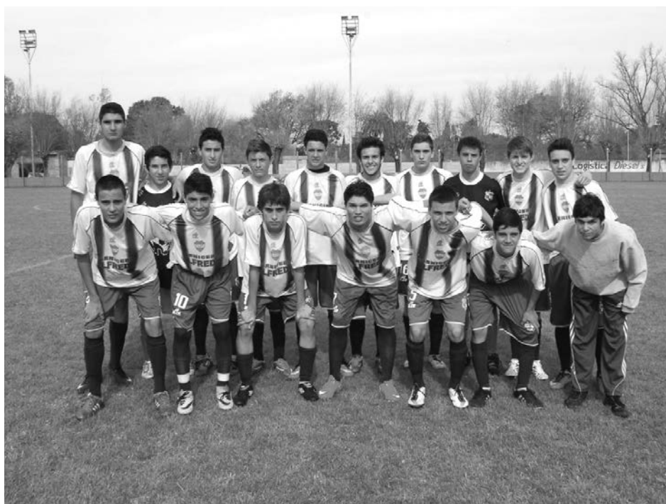
Quinta División de Once Tigres.