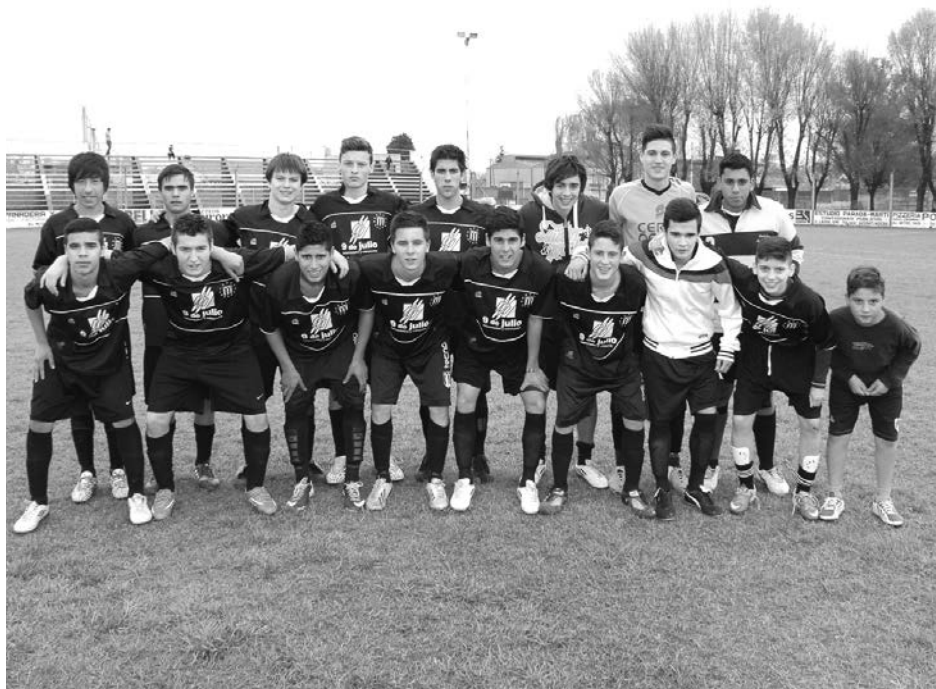
Quinta División de Atlético French.