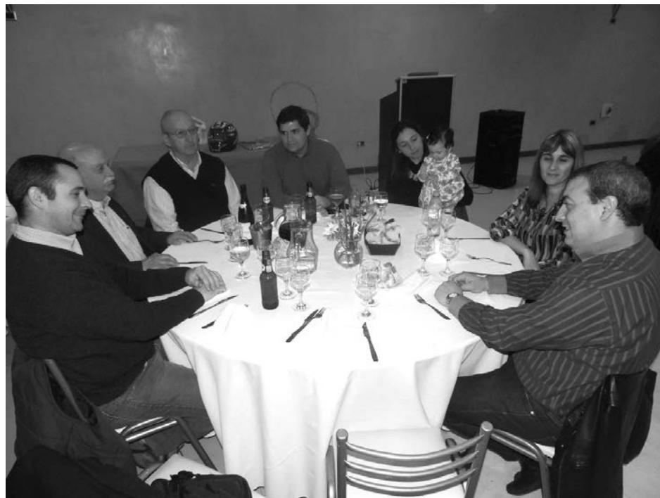
Autoridades municipales y concejales presentes en la noche de gala.