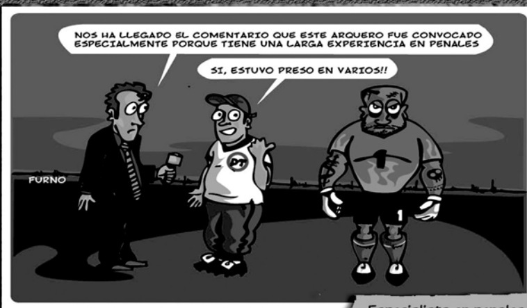
Especialista en penales