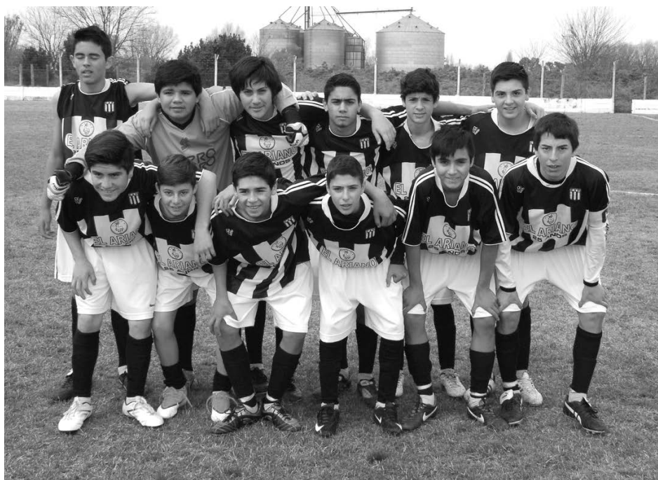
Sexta División de Atlético French.