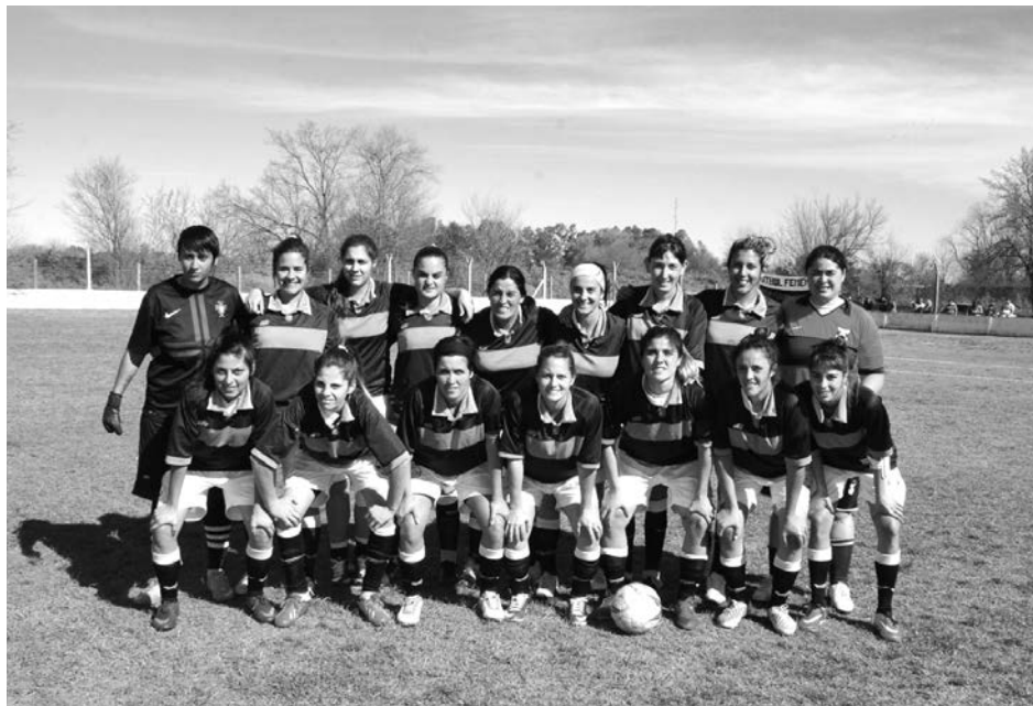
Football Club Libertad.