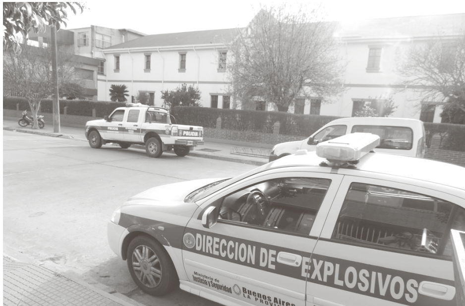
Personal de la Dirección de Explosivos de Junín junto a personal policial y municipal.

En horas de la mañana de ayer, poco antes del horario de ingreso de los alumnos, autoridades del Colegio Marianista San Agustín de nuestra ciudad, fueron alertados sobre una amenaza de la colocación de un artefacto explosivo en el establecimiento educativo; circunstancia que lamentablemente se repite