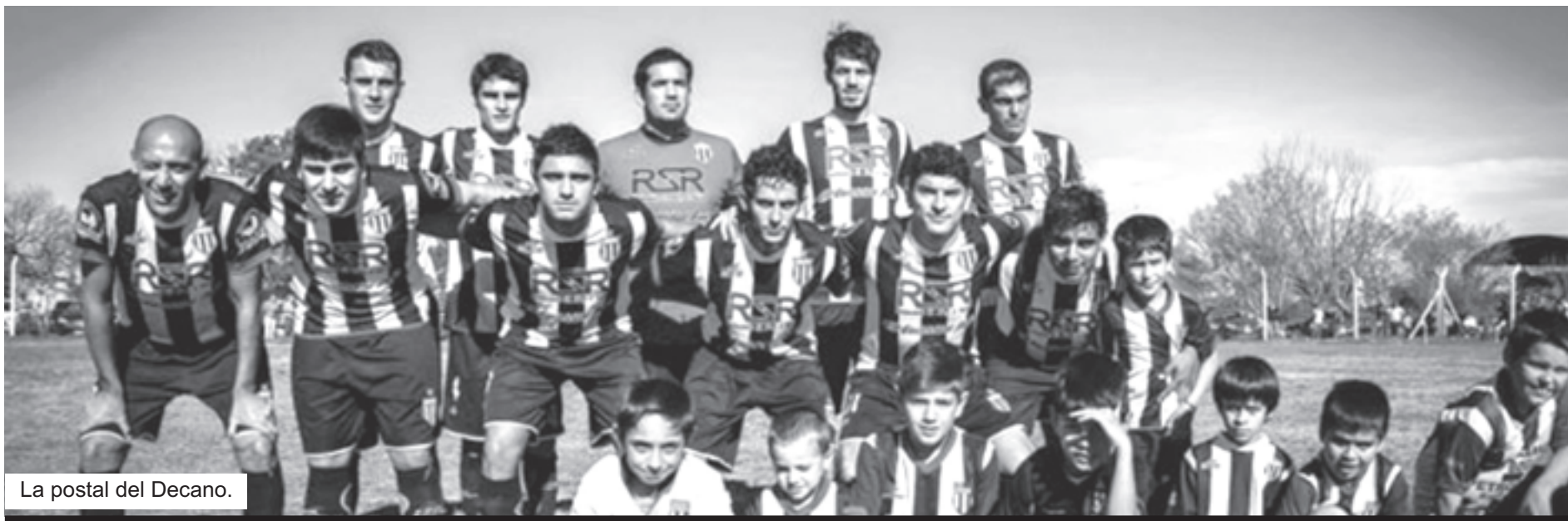
La postal del Decano.