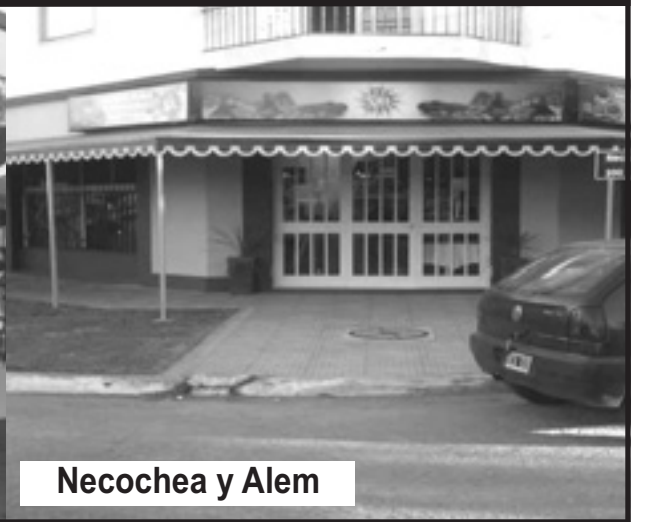
Necochea y Alem