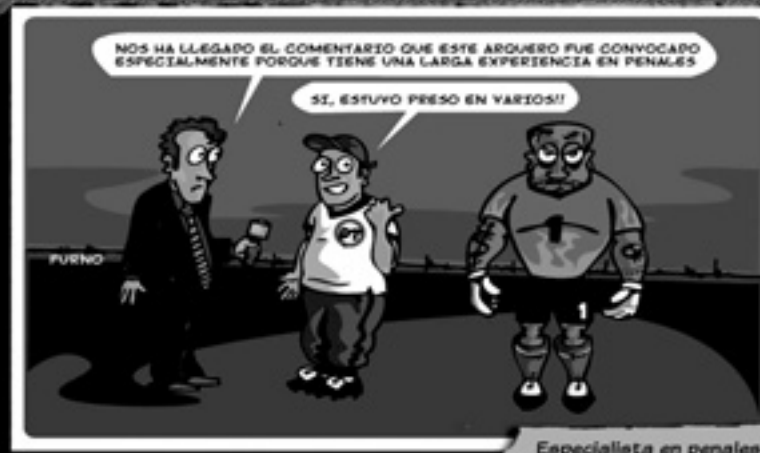
Especialista en penales