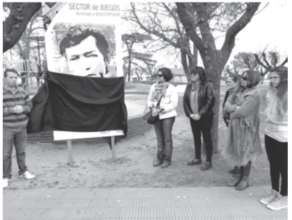
Una postal de la brillante iniciativa.