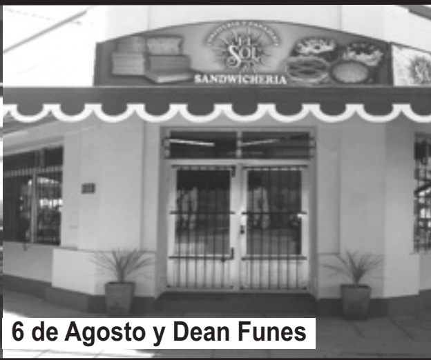
6 de Agosto y Dean Funes