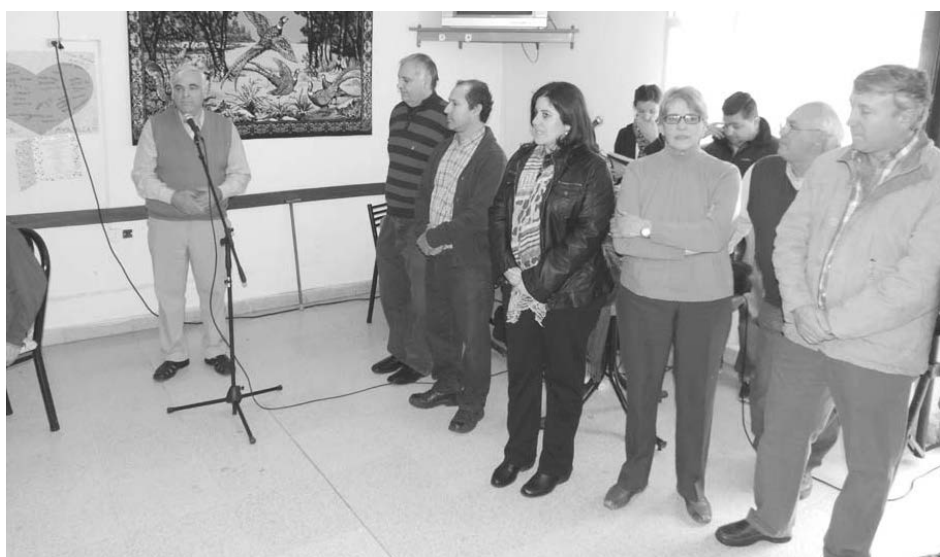
En Intendente felicitó al Hogar y a las entidades que colaboran.