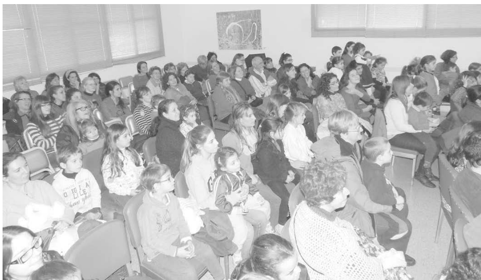
Chicos y padres participaron de la propuesta cultural.