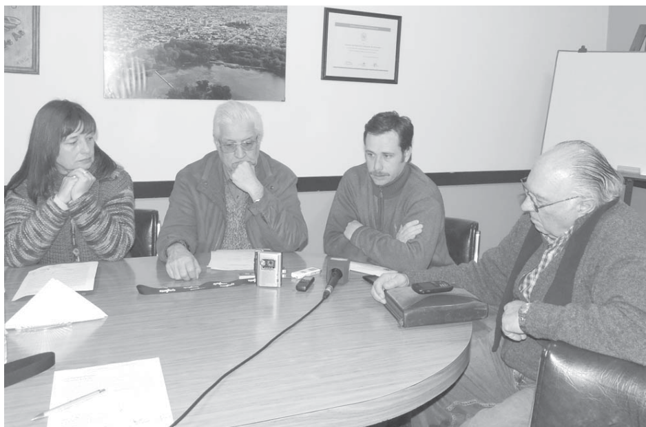
Referentes de Sociedad Rural, Rotary, Club de Leones y Cámara de Comercio, dejaron sus conceptos.

Consultados sobre cuál será la metodología de trabajo de la ONG; sus integrantes adelantaron que se colocarán urnas en la sedes de la Cámara de Comercio e Industria, la Sociedad Rural, el Club de Leones, y Rotary Club, donde los vecinos podrán completar una ficha denominada "Relevamiento de Hechos Delictivos", en las cuales se establecen datos concretos que "serán de utilidad para