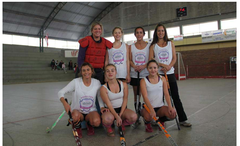
Equipo de La Aurora.

Las tres primeras jornadas fueron de las menores, con 8 equipos del Club Atlético 9 de Julio, 4 de Comodoro Py, 2 de Dudignac y 2 de San Martín, todos representantes de comercios locales, enfrentándose todos contra todos, arribando a las finales: en 9ª división R. A. Ghergo, que venció a Baires Wagen por 6 a 3; luego en 8ª Mariposas se impuso a Cambalachito 3 a 0; y en 7ª, La Madrugada venció a Verde Rana 2 a 0 y de esta manera se consagraron campeonas: de 9ª Ghergo y sub Baires Wagen; en 8ª campeón Mariposas y sub Cambalachito y en 7ª campeón La Madrugada y sub campeón Verde Rana. Los equipos de varones correspondieron 1 a San Martín, 1 a San Agustín y 3 a ex jugadores del Club Atlético 9 de Julio, éstos con distintos nombres, clasificados: primero La Cueva, segundo San Agustín, tercero Los