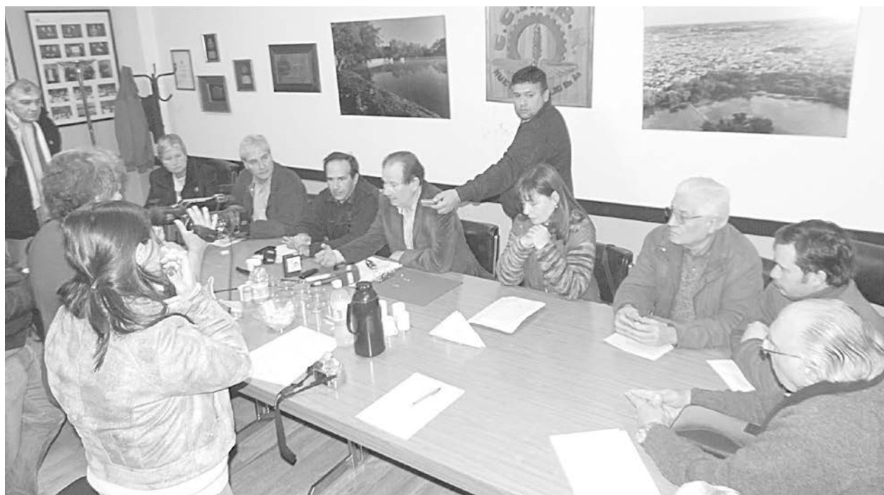
Instituciones de nuestro medio y vecinos presentaron un programa contra la inseguridad.