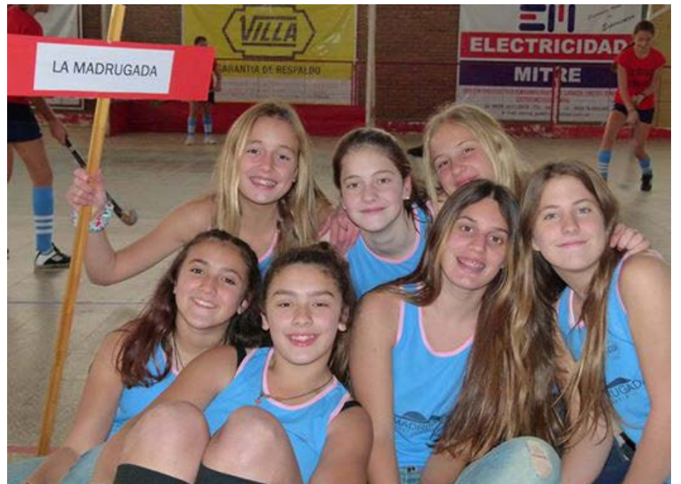
Plantel de La Madrugada.

Tigres, cuarto Los Leones y quinto San Martín.