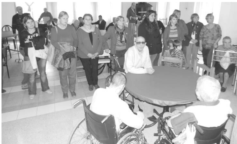
Abuelos, autoridades y público presentes en el acto.