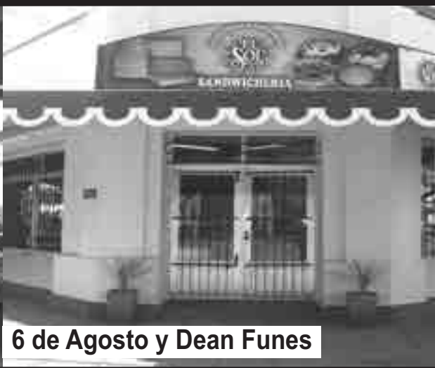
6 de Agosto y Dean Funes