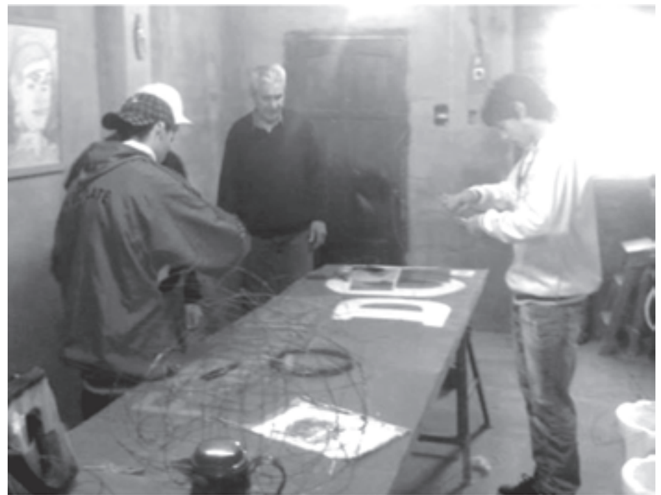
De cara a los próximos carnavales, se podrán observar trabajos mejor logrados.