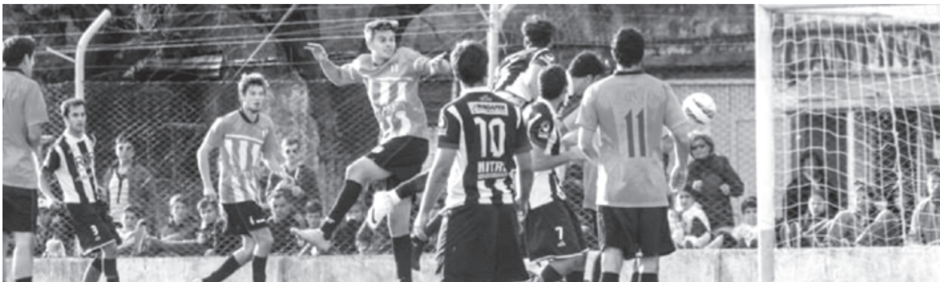
El clásico entre Viamonte y Alsina, el partido de la fecha. Completan Coliqueo vs Defensores, Morse vs La Delfina y Zavalía vs River.