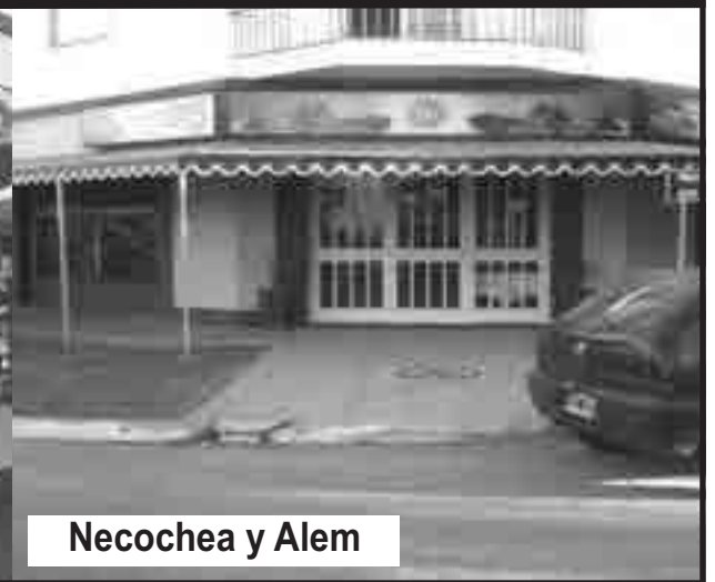
Necochea y Alem