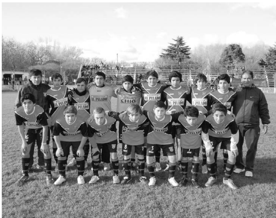
Defensores de Este.