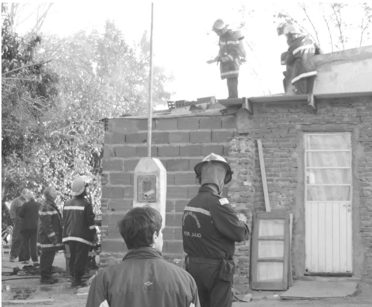
Ardua tarea de Bomberos para sofocar el siniestro en la vivienda.