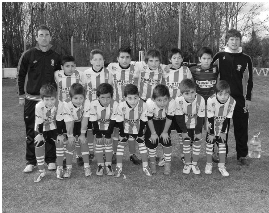
Atl. 9 de Julio 2