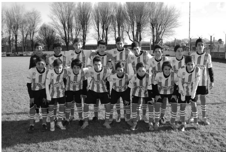
Atl. 9 de Julio