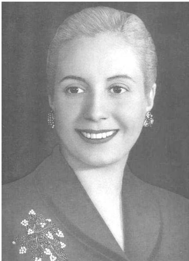
Se realizan varios actos conmemorando a Evita.