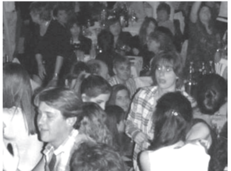
Las chicas tuvieron la oportunidad de disfrutar el día compartiendo una excelente cena.