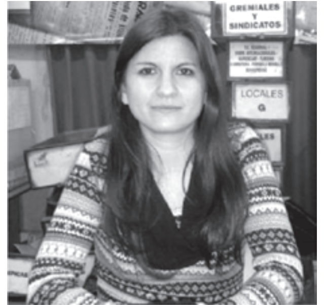
Sequeira trabaja en conjunto con los ediles de JpV.

La funcionaria de la jefatura de Gabinete de la Nación dijo que en Junín "hay una decisión del Ejecutivo local de no implementar este tipo de políticas en su programa de gobierno", afirmó y agregó: "con lo cual creemos que podemos hacer un