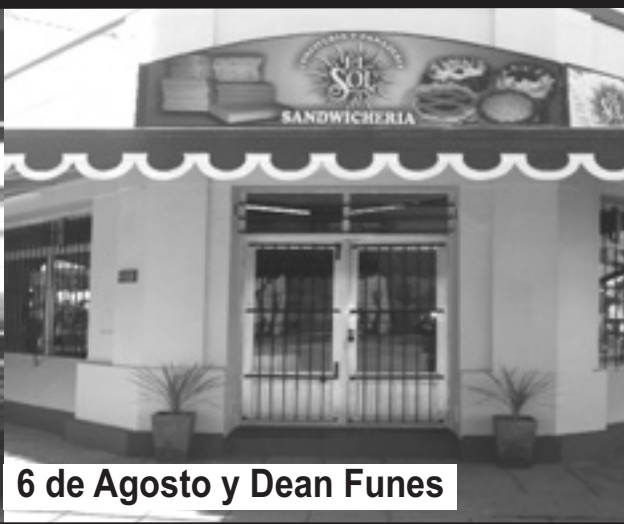
6 de Agosto y Dean Funes