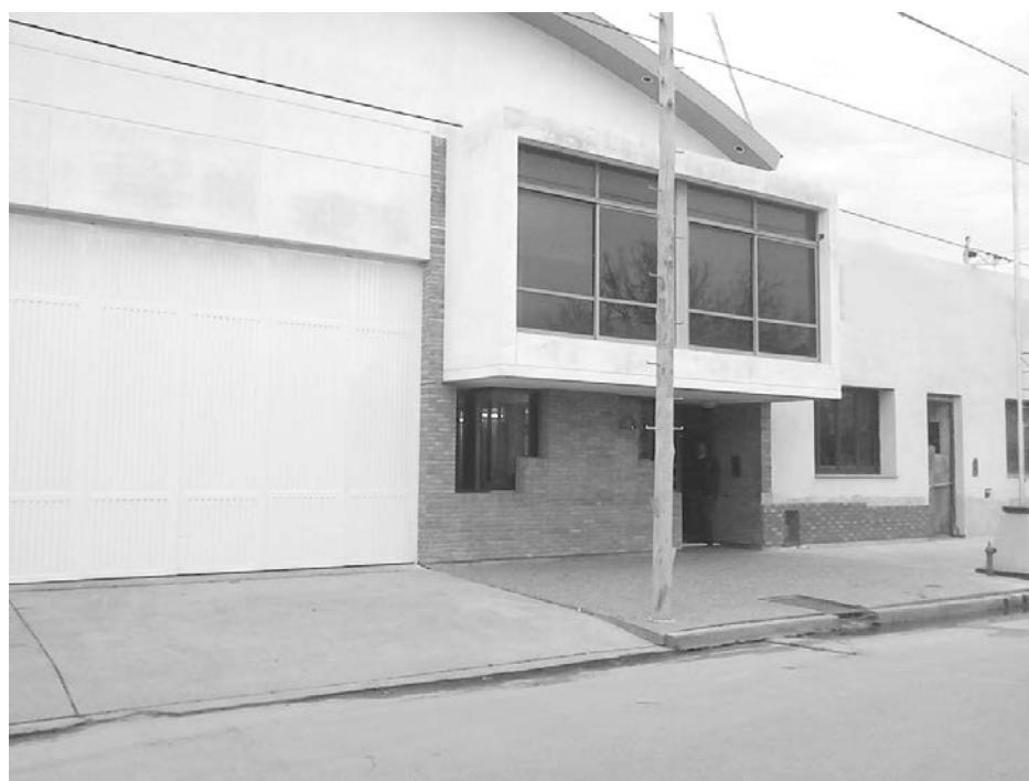
Frente del remodelado cuartel de Bomberos Voluntarios.

para el funcionamiento de la institución. Los costos son muy altos y sería imposible llevarla adelante sin este apoyo".