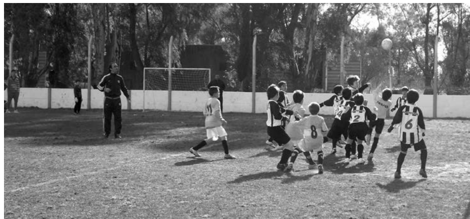
Avance de San Martín impedido por el arquero de French.