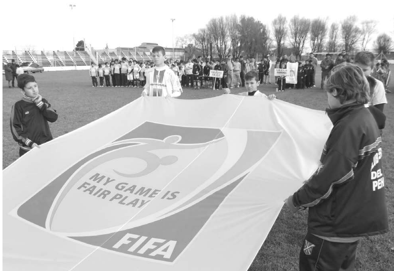
Los pequeños jugadores portan la bandera del Fair Play de FIFA.