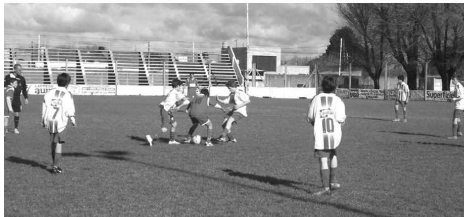
A. Alvarez y Dep. Sarmiento mostraron buen juego y manejo de la pelota.

Deportivo Sarmiento 0 - A. Alvarez 0 Atl. 9 de Julio 1 - Def. de Pehuajó 0