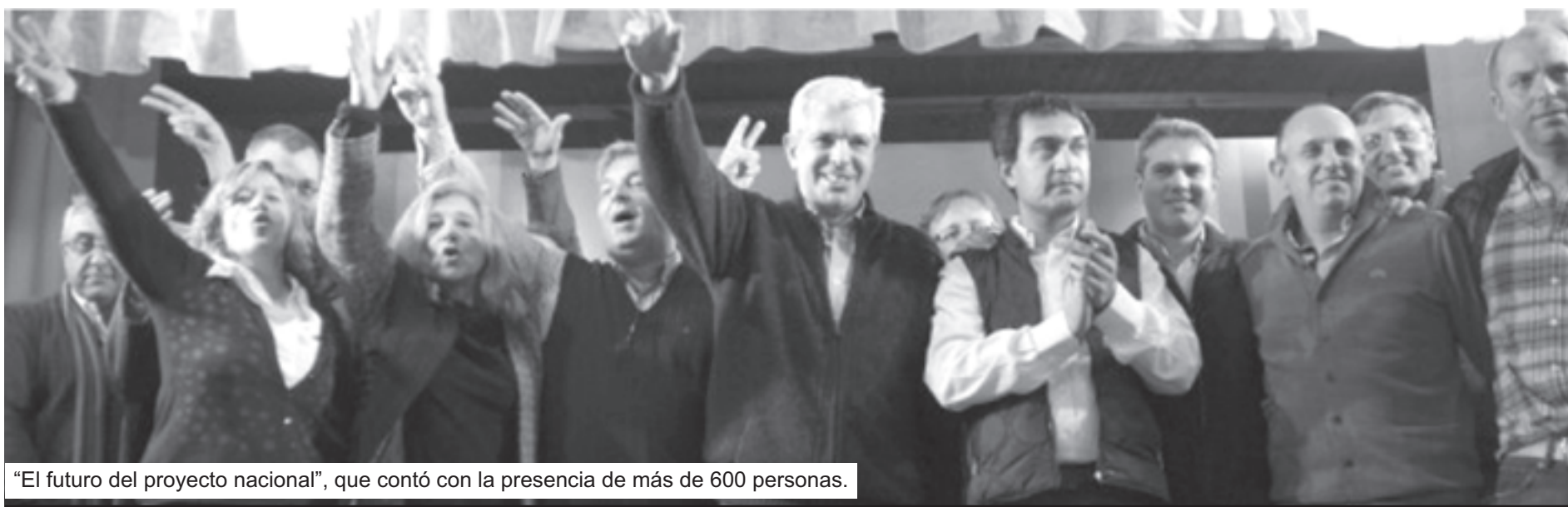
"El futuro del proyecto nacional", que contó con la presencia de más de 600 personas.