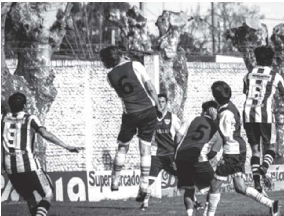
CANCHA DE COLIQUEO - Ig. Coliqueo 0 - Alsina 1

EN ZAVALIA - Defensores 1 - Sp. Zavalía 1