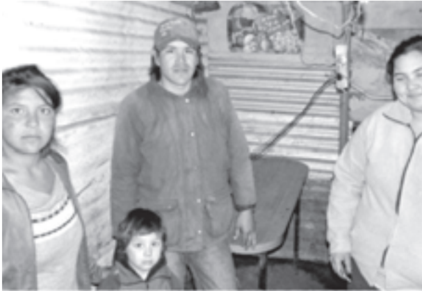
Una familia pide ayuda social.

no tuvo progresos significativos a la hora de "evaluar las deudas habitacionales todavía pendientes de resolución".