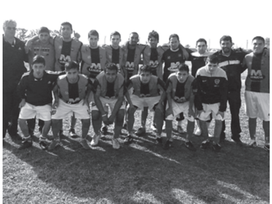
EN MORSE - Belgrano M. 1 - River Plate 2