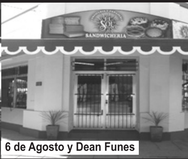
6 de Agosto y Dean Funes