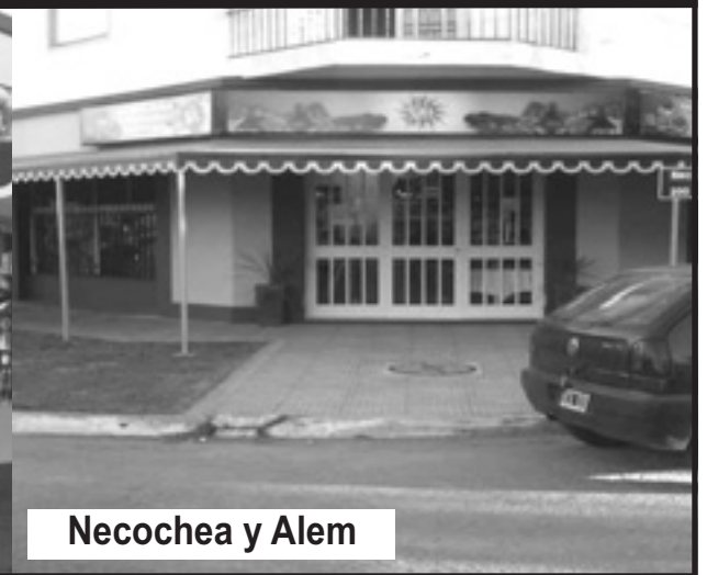
Necochea y Alem