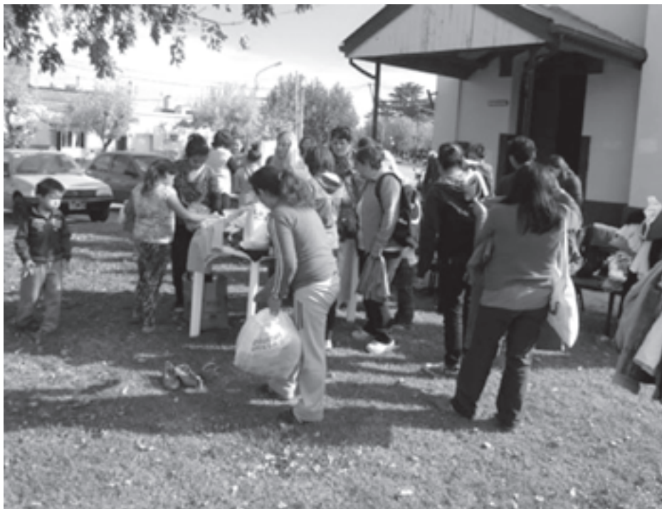
La gente colaboró asistiendo el linda tarde.