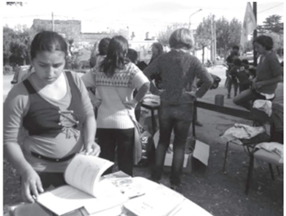
La estación de tren fue el lugar de encuentro.