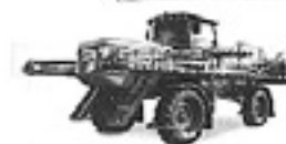
Pulverizadora Autopropulsada Choroque 3227