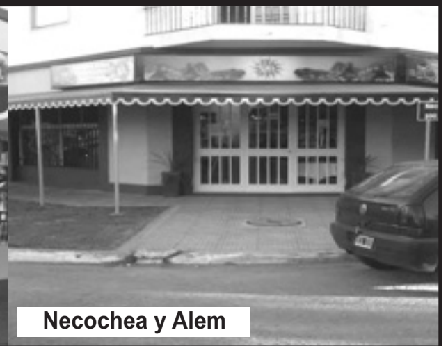
Necochea y Alem