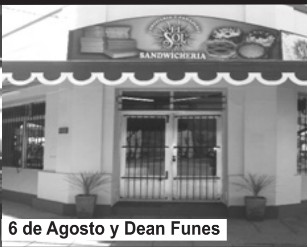
6 de Agosto y Dean Funes