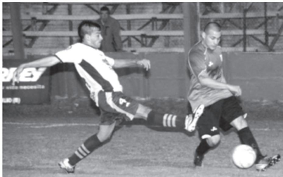
Once Tigres 6

Posiciones Camioneros 15 Tres Algarrobos 13 Estudiantes 12 Alianza 11 Sports Salto 7