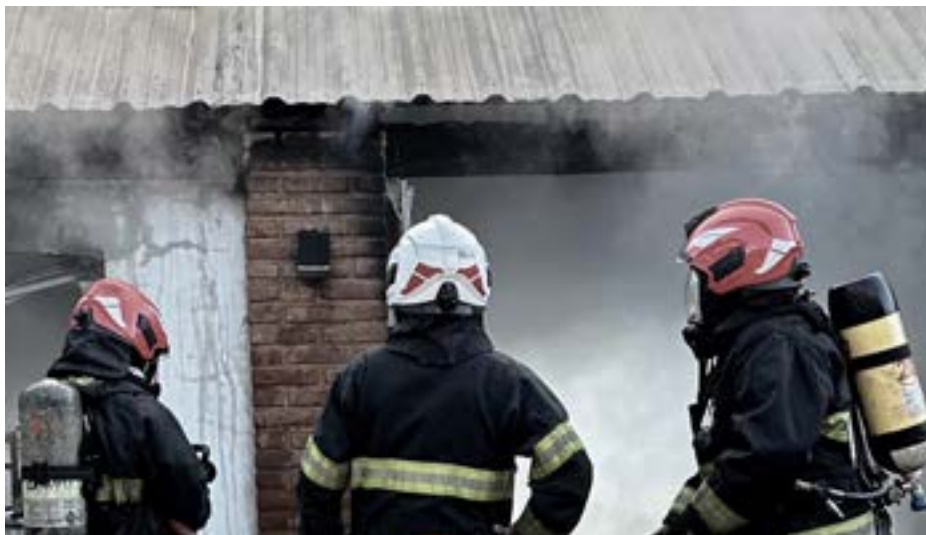
Una vivienda de la localidad de El Provincial sufrió daños totales tras un incendio registrado en la noche del miércoles último, y tras el siniestro,

los vecinos se organizan para colaborar con la familia damnificada. Afortunadamente el hecho no produjo víctimas personales, pero los daños en la estructura y pertenencias de la familia Tojo fueron muy importantes. Por ello, los vecinos de la localidad se encuentran colaborando a través de una campaña solidaria de donaciones de dinero, que pueden efectuarse a través del alias diego.tojo