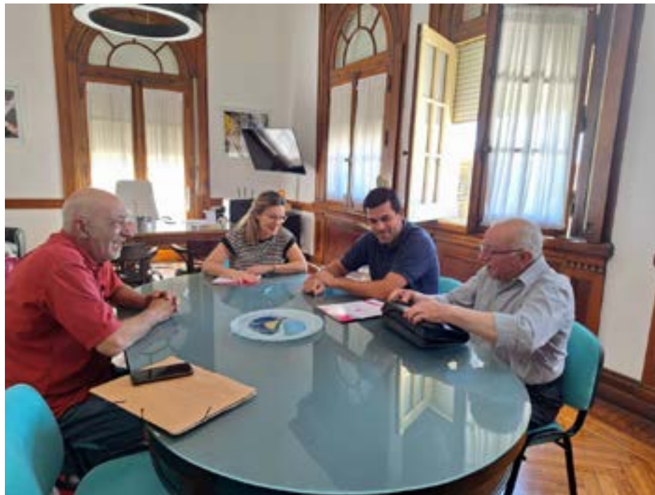
en su acondicionamiento.

Este nuevo ámbito era un viejo anhelo de la institución quiroguense, que comenzará de inmediato