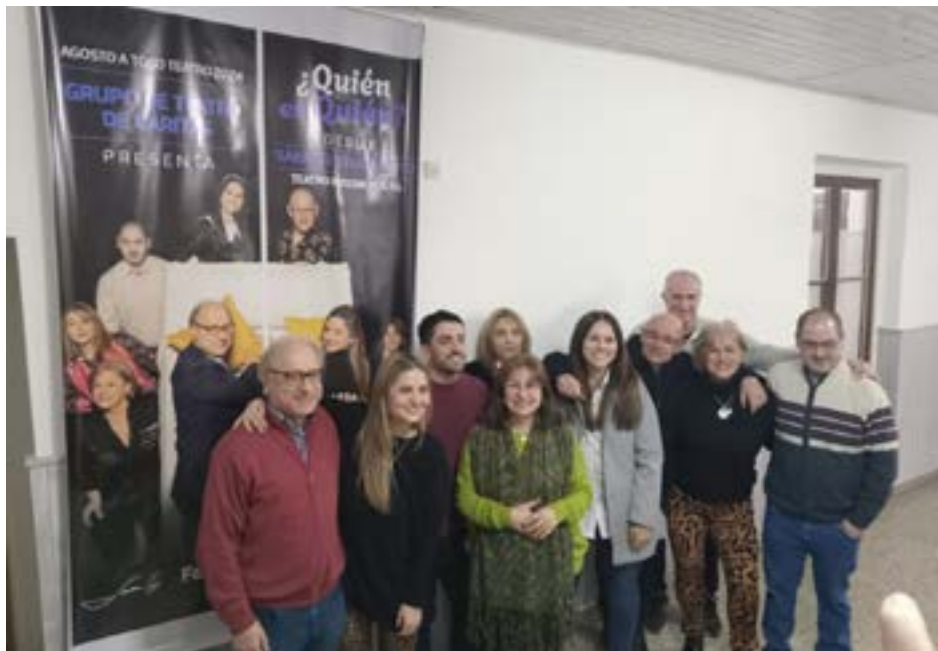
El elenco de esta nueva temporada posa para los medios locales

El grupo de teatro de Caritas presentó el viernes lo que será la 33ª edición del tradicional ciclo benéfico "Agosto a Todo Teatro", en esta oportunidad, con la presentación de la obra "¿Quién es Quién?", de Autor Anónimo.