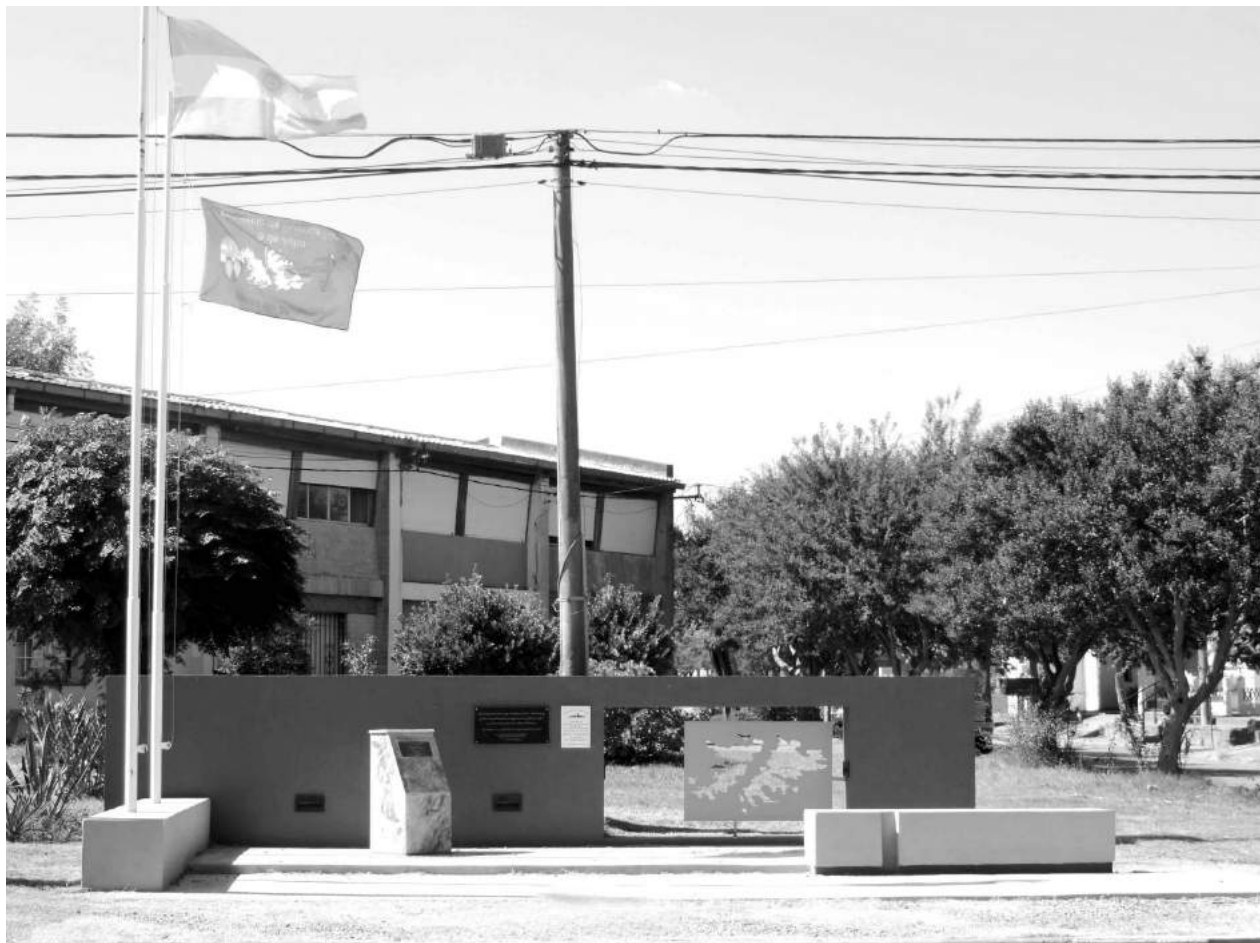
Lugar de homenaje a la Gesta de Malvinas donde se encuentra emplazado el monolito que recuerda al Soldado Francisquez.