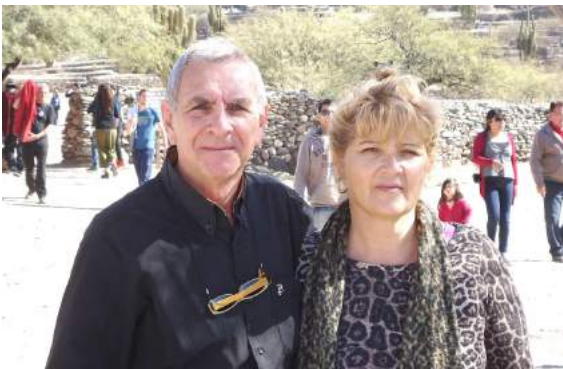
Conduce: Héctor Rodolfo Tinetti Cámaras: Micaela María Petetta