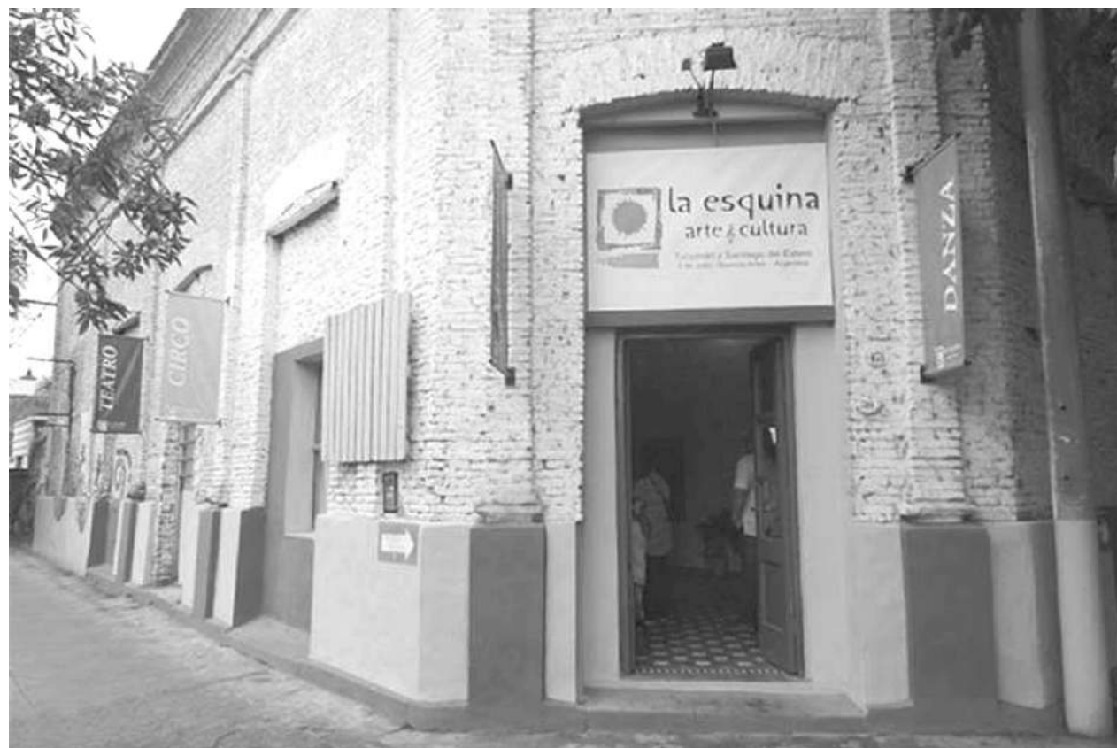
"La Esquina" comenzó el año con distintas actividades y eventos culturales.

CON EL AUSPICIO DE LA UOM Y EL SINDICATO MUNICIPAL