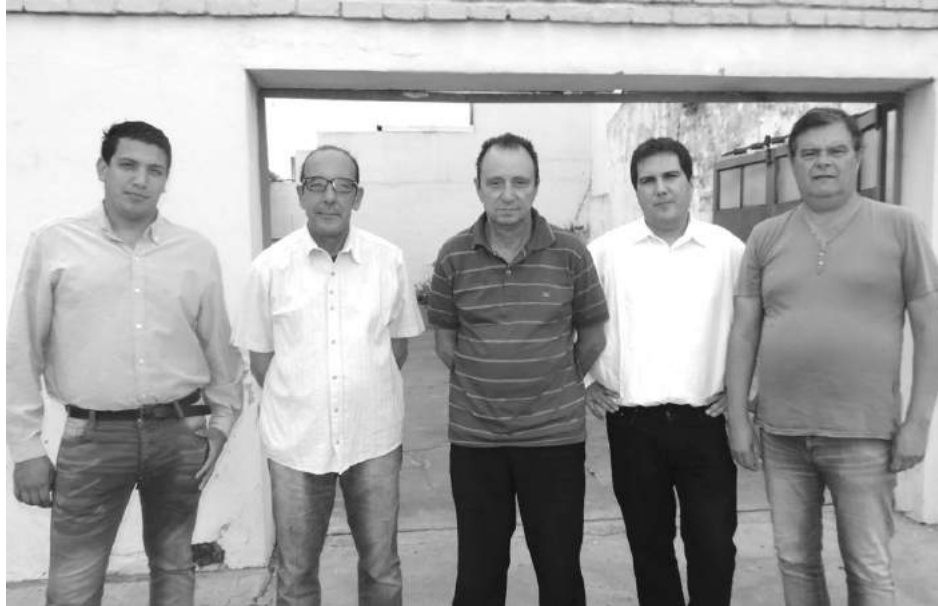
Responsables de llevar adelante los cursos de capacitación de Caprof que llega por primera vez a 9 de Julio.

Así lo aclaró el representante de CaProf (encargada del dictado de la capacitación) que tendrá lugar en la sede del Sindicato de Trabajadores Municipales, para personas a partir de los 10 años de edad.