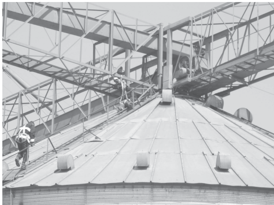
En la foto se pueden observar a los Bomberos trabajando a unos 20 metros de altura, sobre el silo.

en la noche anterior y se había aplacado, pero a medida que el mismo se va descargando, se descubre el foco ígneo y enciende a llama viva. Anoche comenzó a arder nuevamente y acá estamos trabajando junto a la gente de la planta", expresó, al indicar que se trabajó con dos dotaciones -autobomba y una cisterna- y un total de 12 hombres, mientras que el resto del plantel activo fue convocado en el cuartel para ir haciendo los relevos correspondientes.