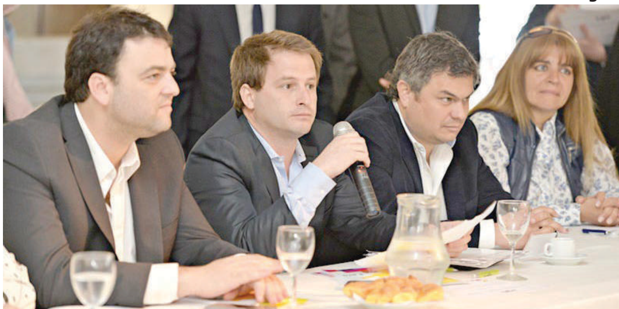
El Intendente Municipal participó de la asamblea partidaria.