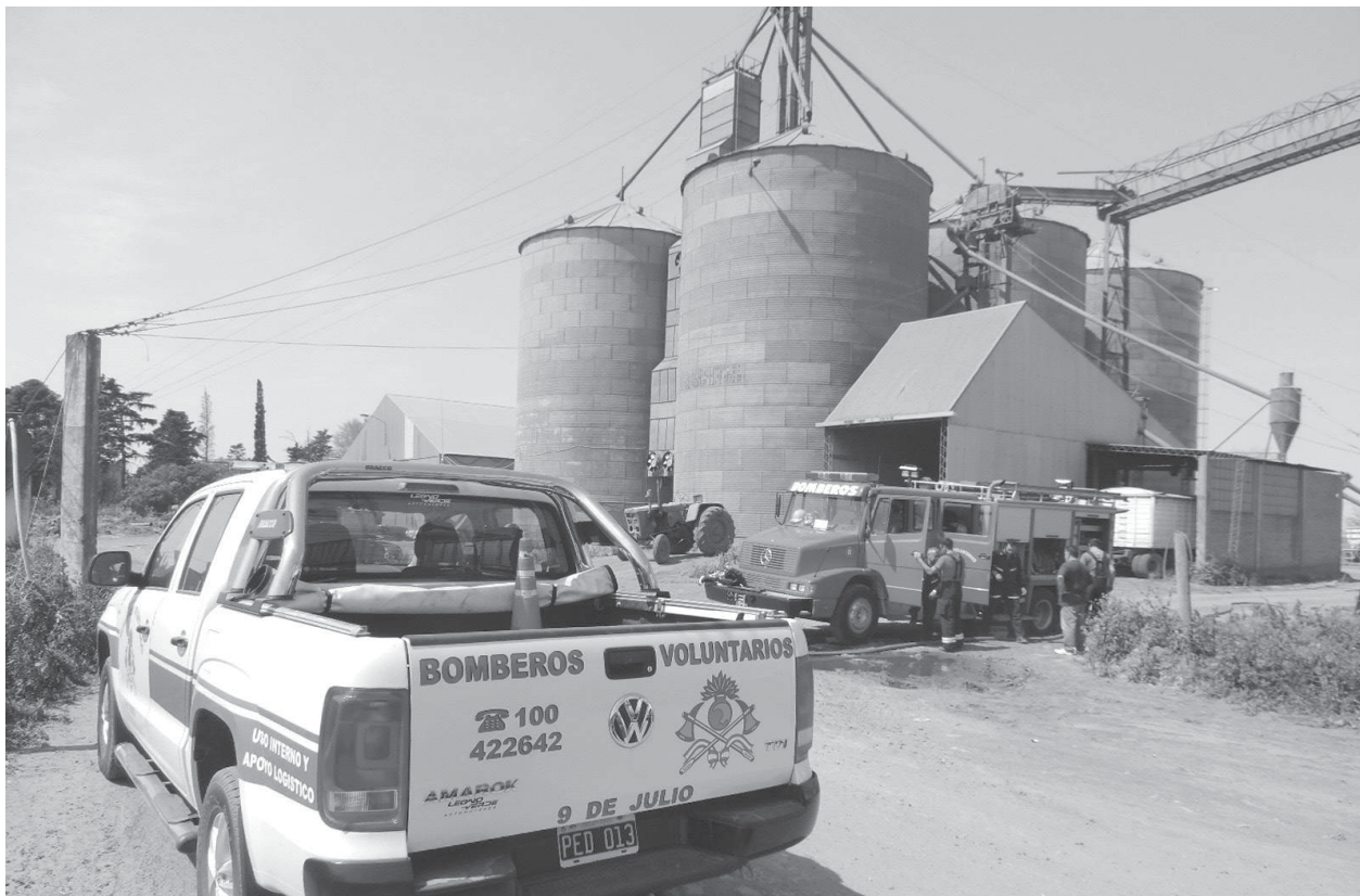
Ardua tarea de Bomberos Voluntarios para controlar el fuego dentro del silo.

Se trabajó con dos dotaciones -auto-bomba y una cisterna- y un total de 12 hombres, mientras que el resto del plantel activo fue convocado en el cuartel para ir haciendo los relevos correspondientes. Inf. en Pág. 2.