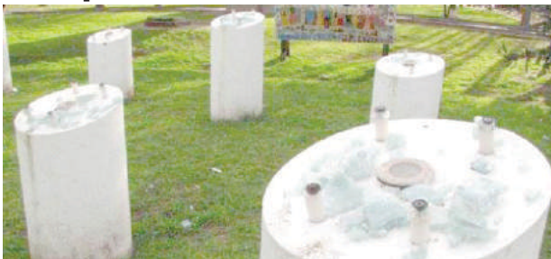
Algunos de los daños provocados en el Paseo.

La Plata, 28 Sep (InfoGEI).- En los últimos días, se produjeron destrozos sistemáticos en el Paseo de la Memoria de Necochea, el cual posee 22 placas que representan y rinden homenaje a los militantes desaparecidos de ese distrito bonaerense. Desde la Comisión local por la Memoria Militante calificaron las agresiones como actos de "odio e impunidad" y señalaron que las siete placas que no fueron atacadas fueron entregadas a los familiares de las víctimas del terrorismo de Estado para que "estén mejor cuidadas".