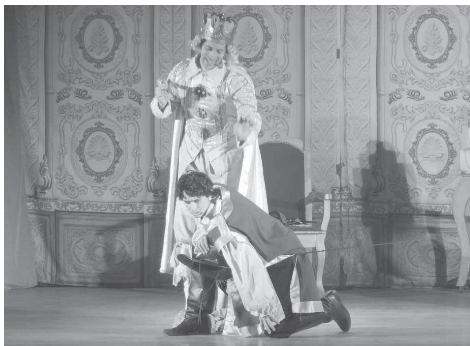
A sala llena de alumnos se presentó la obra teatral en inglés.