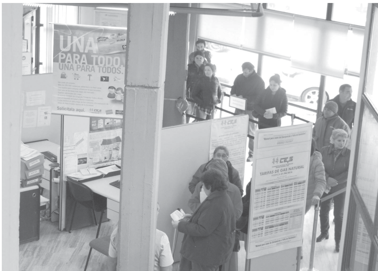
Los usuarios regularizan las facturaciones de luz y gas en la sede de la CEyS.