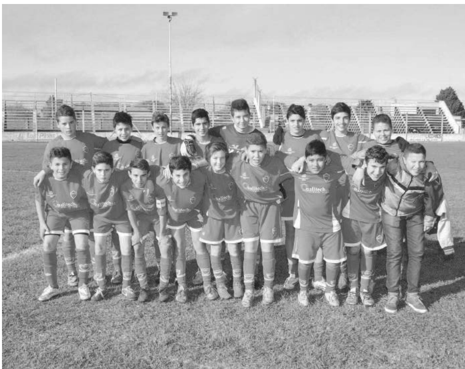
6ta. categoría Club Agustín Álvarez