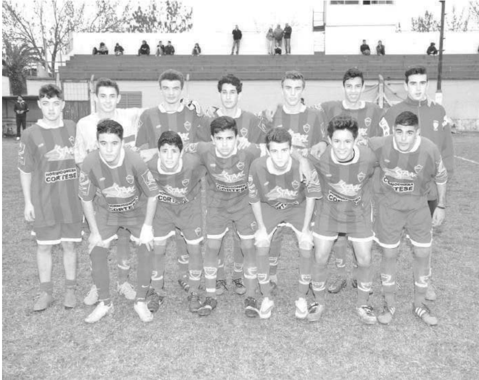
5ta. categoría Escuela Galvani.