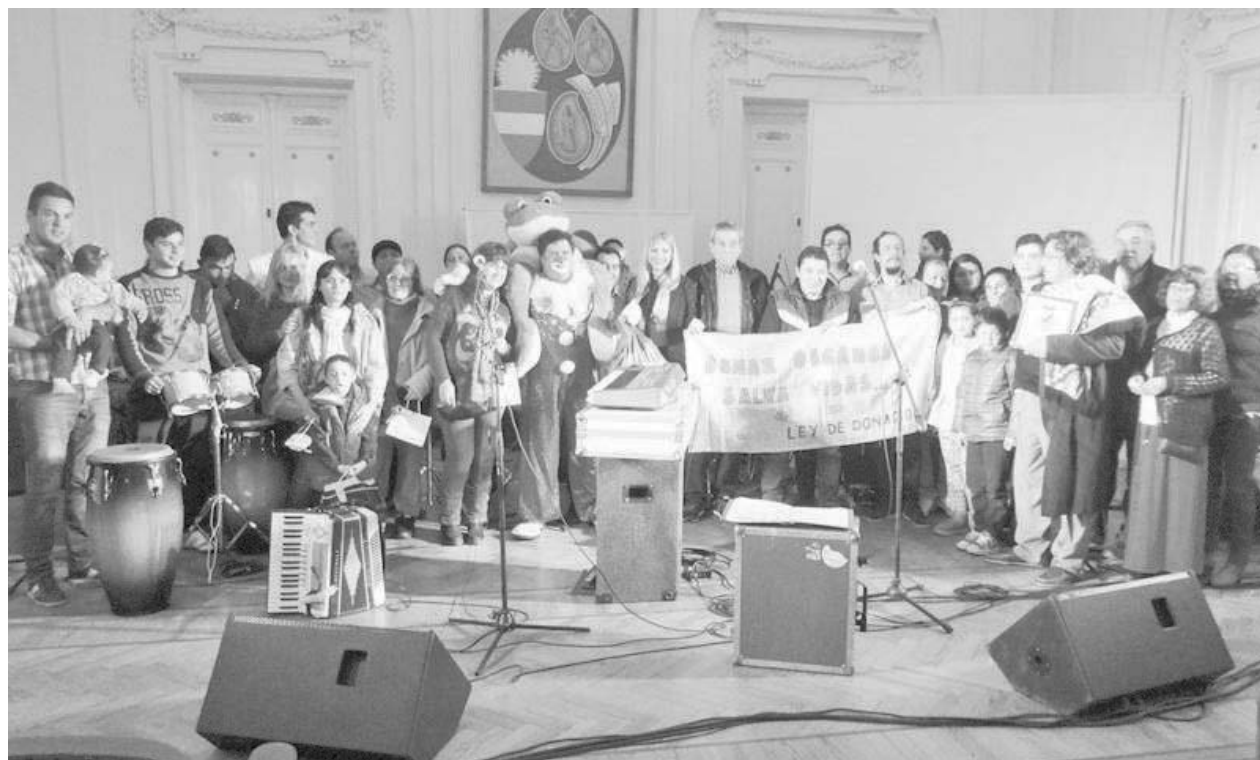
La Asociación Manhala llevó adelante la importante jornada en el Salón Blanco.