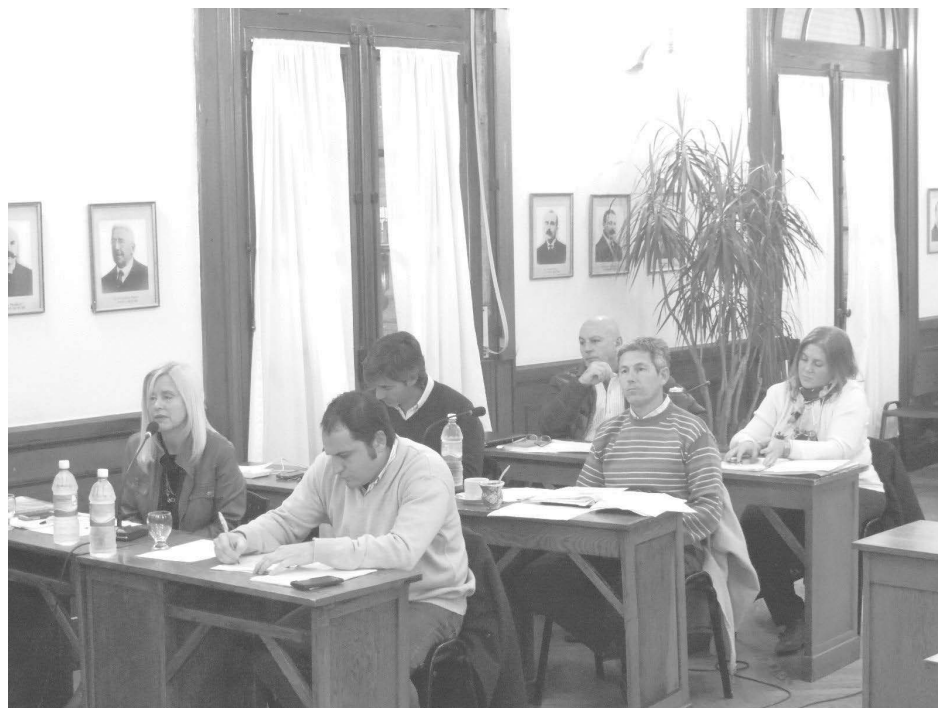
Los ediles cuestionaron la Rendición de Cuentas y la situación del Matadero Municipal.

En el mismo orden señaló que "el ex Intendente Battistella sigue sin brindar información, a la vez que las decisiones de Gobierno