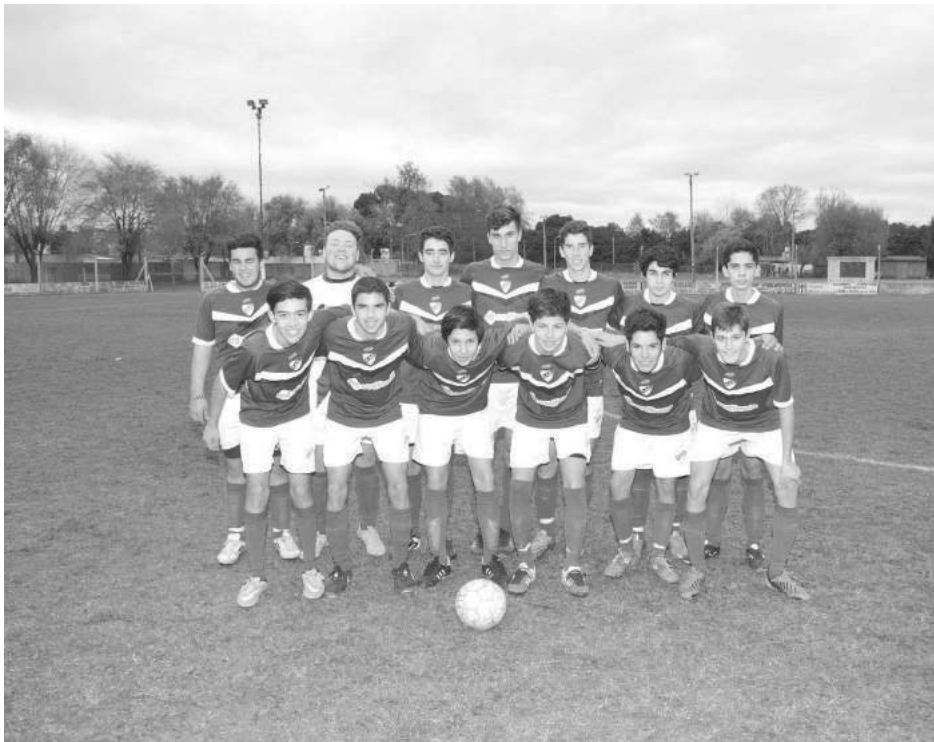
5ta. categoría Club Atlético Quiroga.