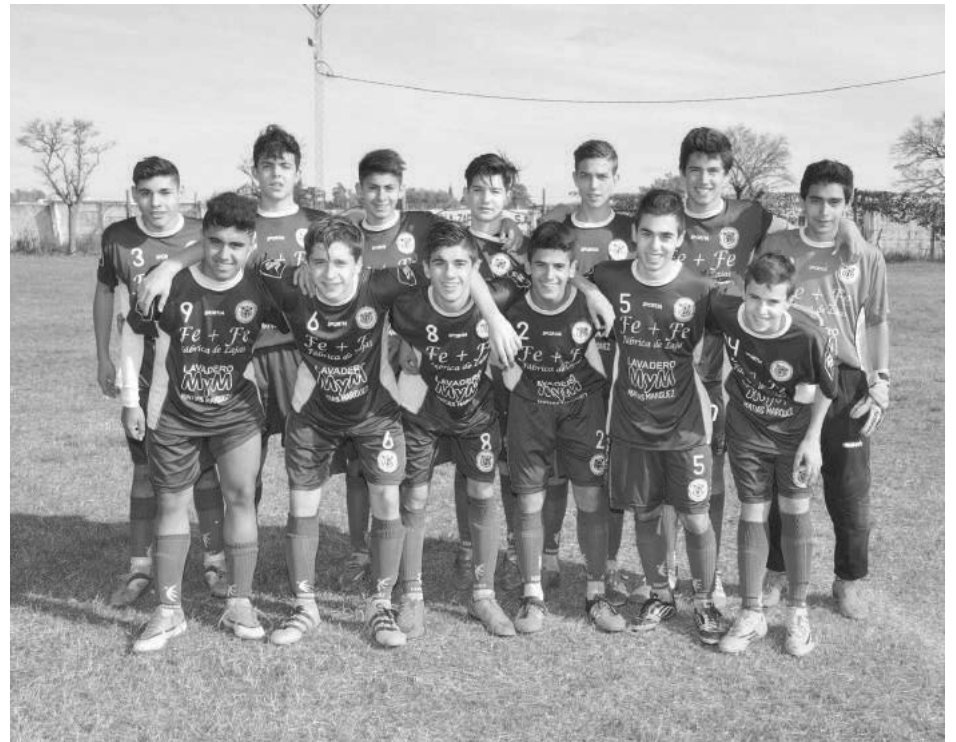
5ta. categoría Club San Agustín.