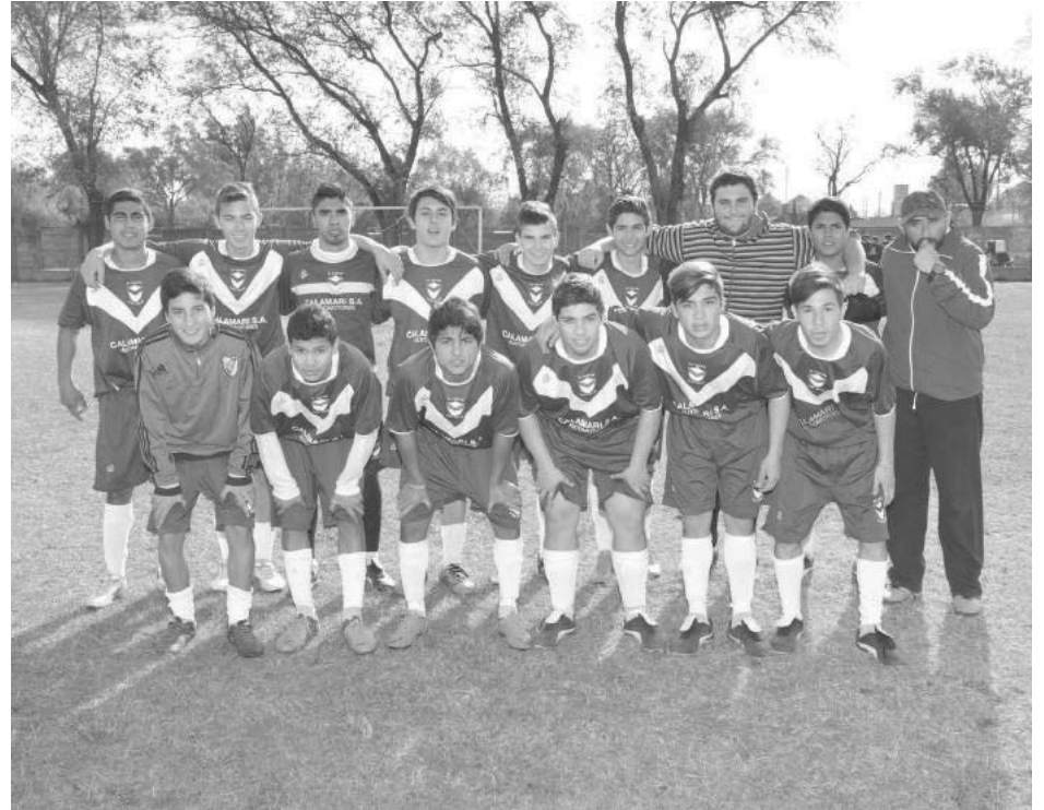
5ta. categoría Club El Fortín.