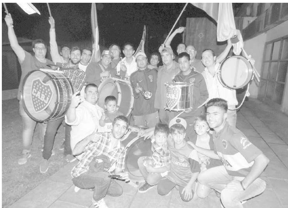
La murga de La 12 presente en la cena show de la Peña.