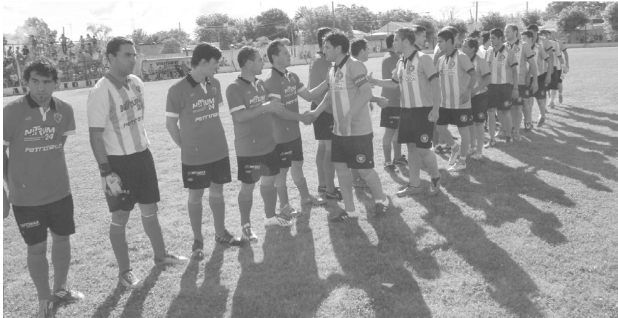
Saludo de los jugadores antes del inicio del partido.

Lo ganaba por 2 a 0 en el primer tiempo, 12 de Octubre lo empató, y cuando tenía dos jugadores menos, en tiempo de descuento, Lacarra le dio la victoria.