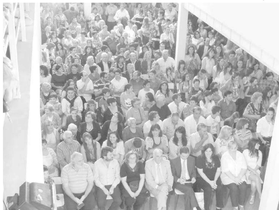
Autoridades del ISETA, municipales y familiares de los egresados presentes.