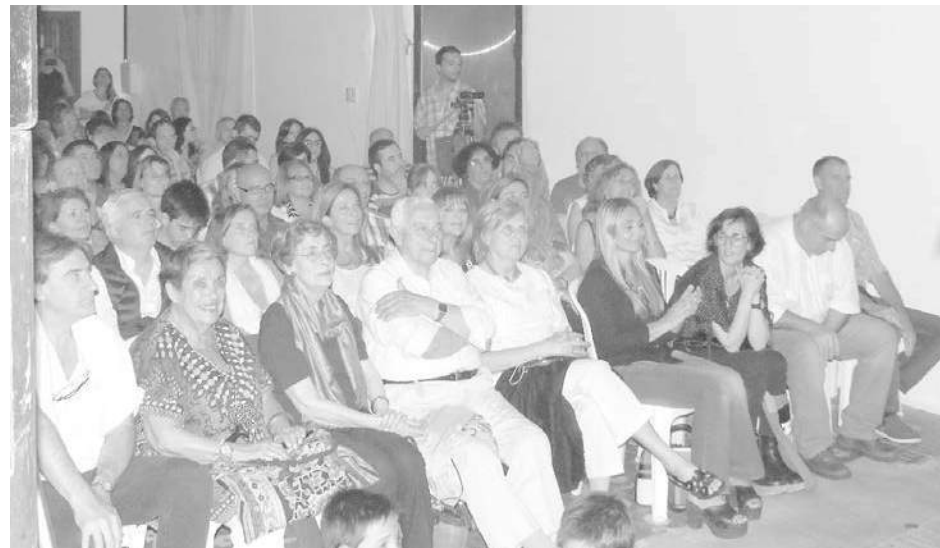
El público colmó el salón y disfrutó de un show de primer nivel.