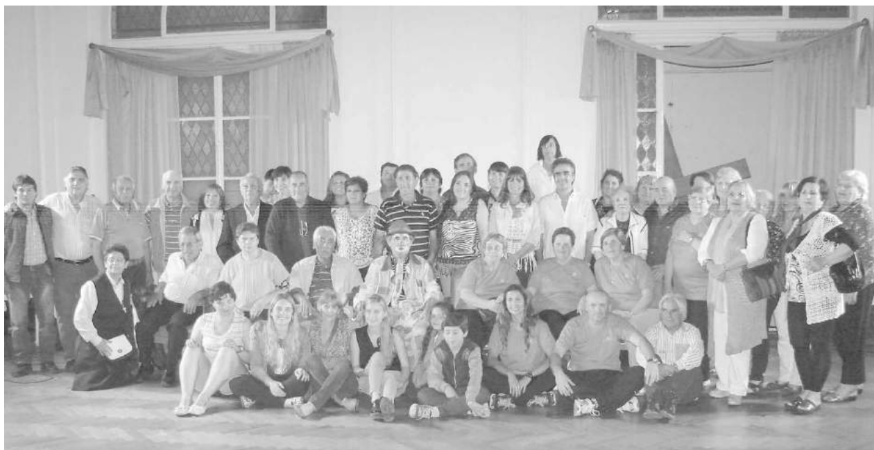
La foto pedida: Rabanito y us amigos en el Salón Blanco municipal.