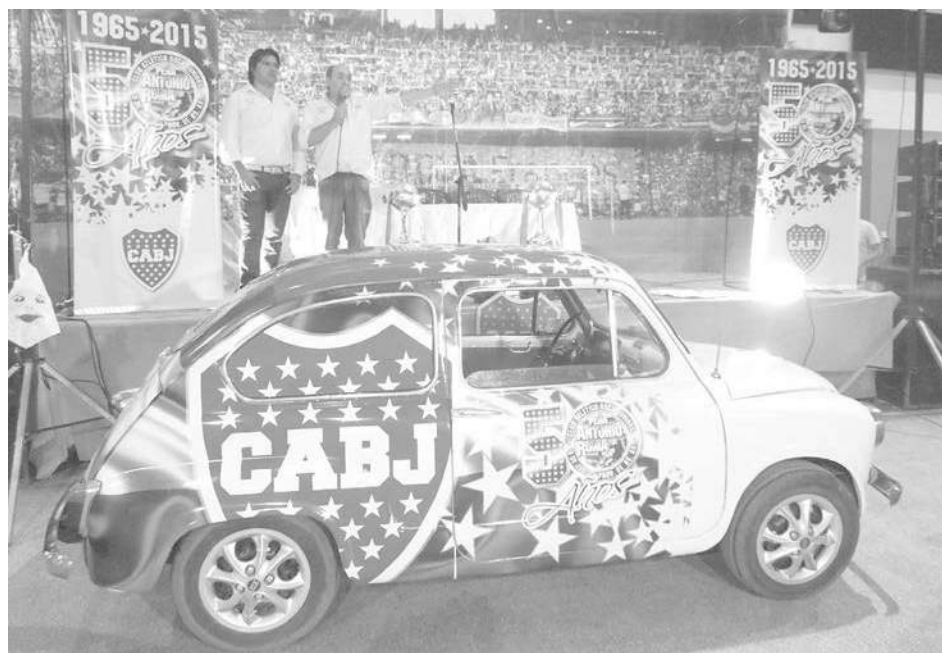
El Fitito íntegramente ploteado que será sorteado fue la vedette de la noche.

ciendo el interior, ya que las Peñas a lo largo de este año en Colectas Solidarias recolectaron 600 litros de sangre, 50.000 tapitas para el Hospital Garrahan, se repartieron más de 300 sillas de ruedas, por lo que quere-