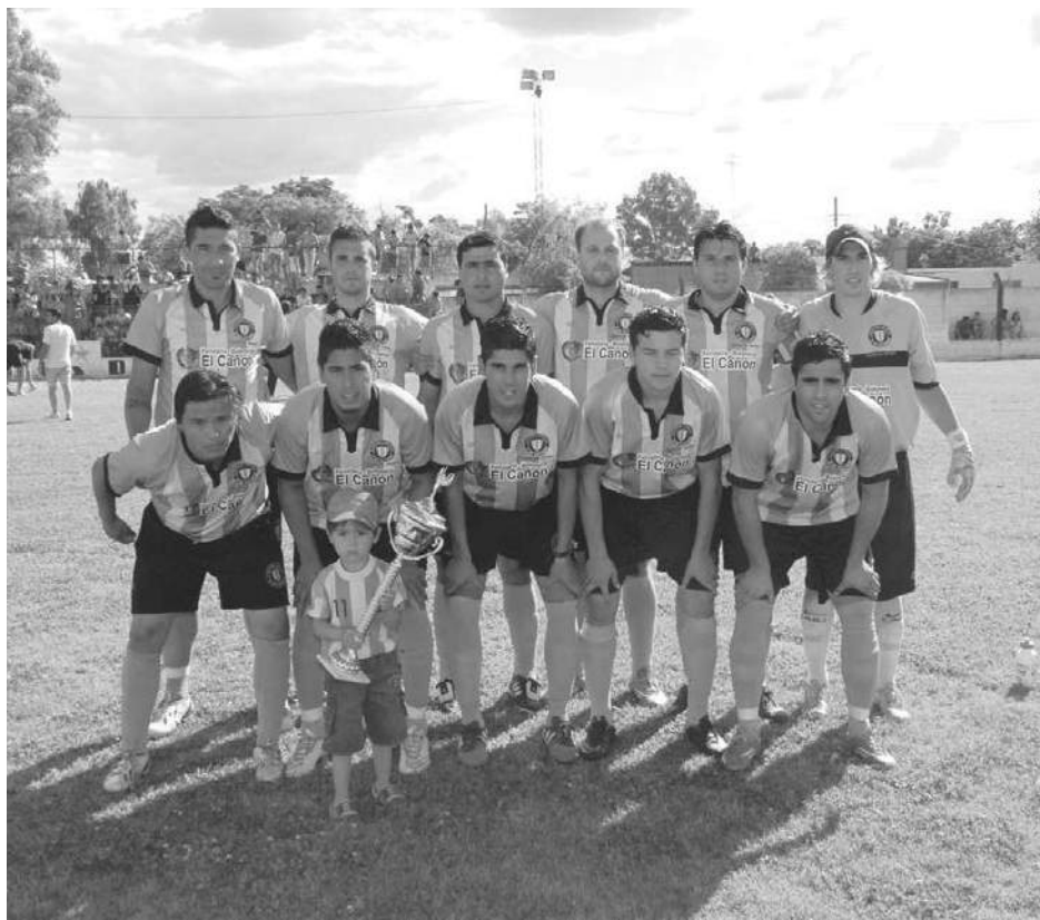
12 de Octubre deberá revertir el resultado en el partido de vuelta, en condición de visitante.