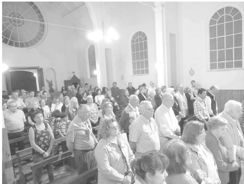
Autoridades eclesiásticas, municipales y vecinos en el oficio religioso.

La comunidad de Dennehy celebró el pasado sábado el 90 aniversario de la Capilla "Nuestra Señora del Carmen", instancia que motivó la realización de una