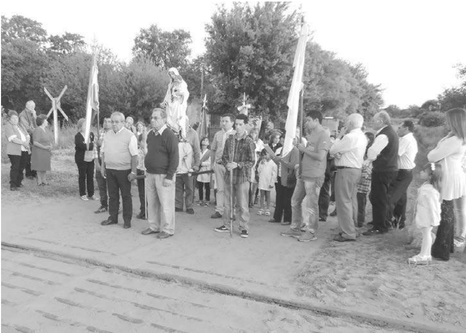
Como hace noventa años, la procesión hasta la Capilla comenzó en las vías del ferrocarril.