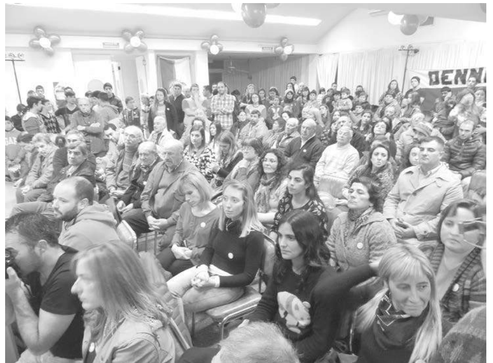
Afiliados, adherentes y simpatizantes presentes el sábado pasado.

En uso de la palabra, el propio Battistella procedió a la presentación de la nómina de precandidatos a concejales de esta fuerza política, la que está conformada de la siguiente manera: