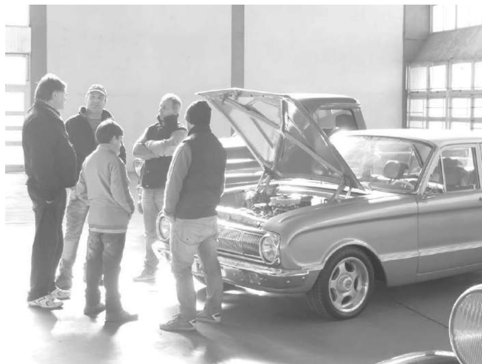
El 49° aniversario del Centro se celebró con una Expo Automóvil el sábado y domingo.