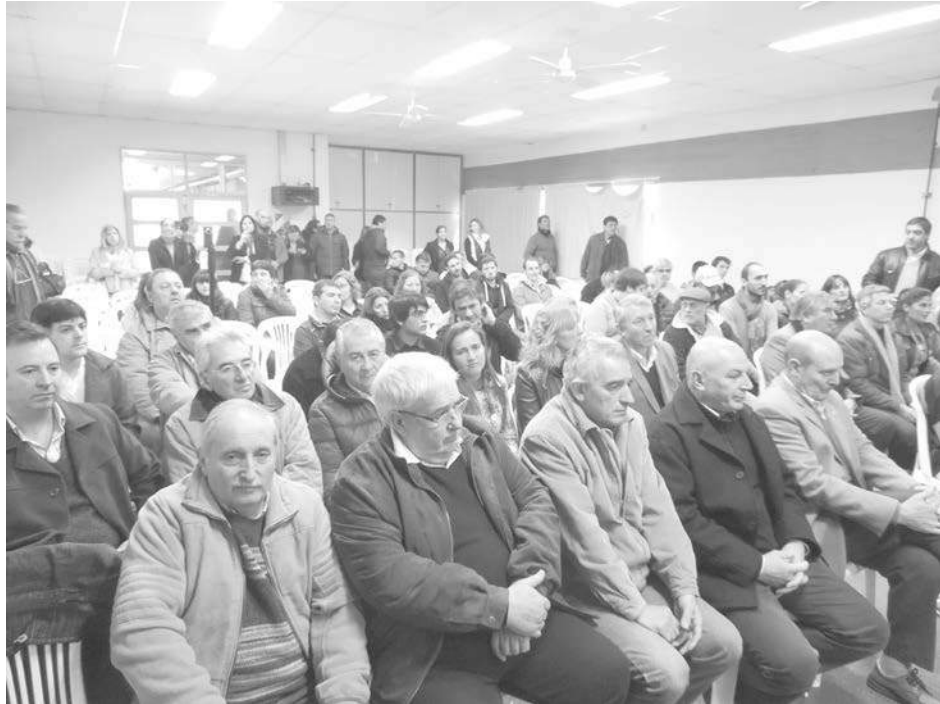
Autoridades educativas, políticas y empresarios participaron del acto.

El Jefe de Gabinete del Gobierno Nacional y precandidato a Gobernador bonaerense por el Frente Para la Victoria ofreció una interesante rueda de prensa para los medios locales en la que fijó sus pautas de campaña.