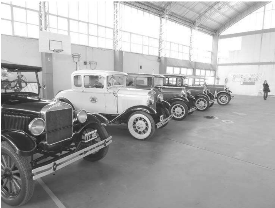
Distintas marcas y modelos presentes en el SUM de la ex Escuela Normal.