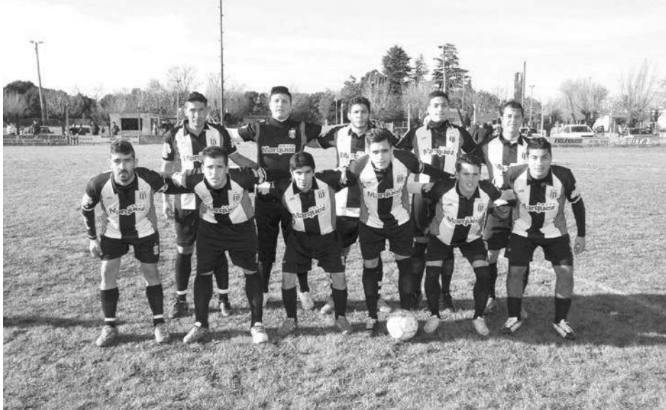
Atlético La Niña.

El Tricolor lo ganaba, pero el Rojo lo dio vuelta sobre el final; en tanto que Quiroga terminó empatando tras ir en ventaja ante San Agustín – Triunfo de Dudignac y empate en el clásico.