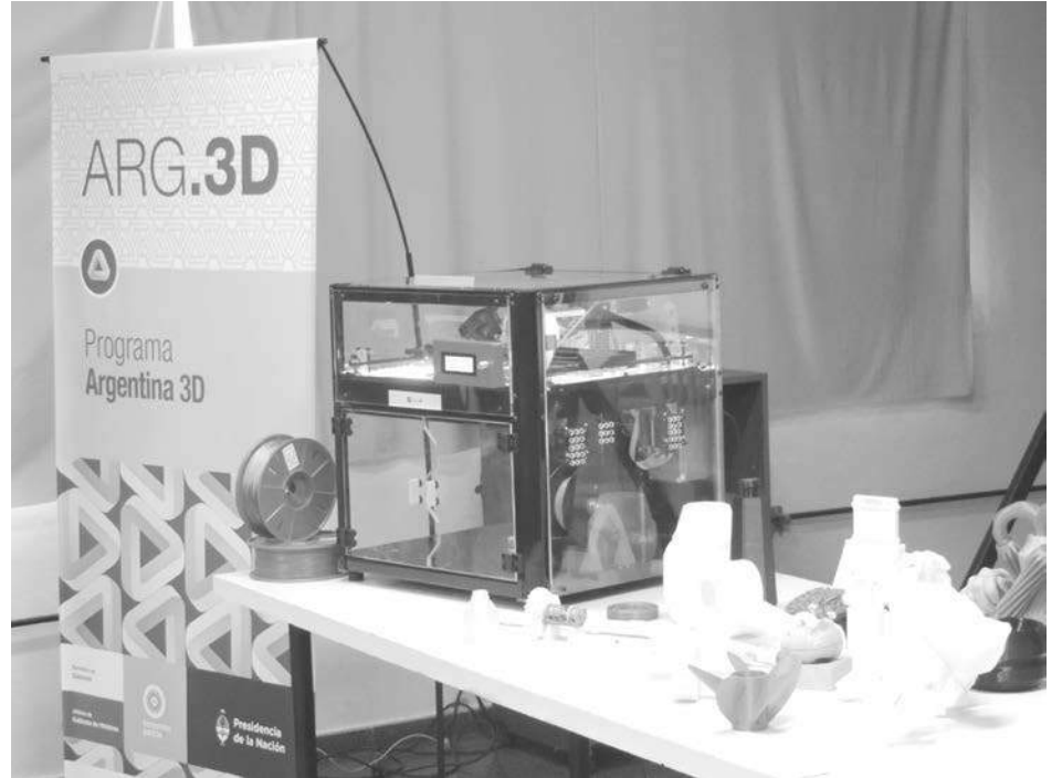
Vista de la impresora 3D -fabricada en nuestro país- que fue entregada a la EET Nro. 2 en el día de ayer.