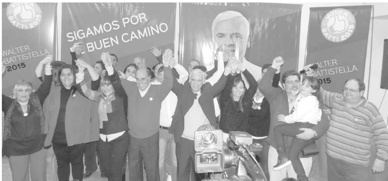
Los precandidatos tomados de las manos saludan en el cierre del acto.

El jefe comunal nuevejuliense, que busca la reelección al frente del Ejecutivo Municipal, destacó la importancia que adquieren las PASO, presentó el proyecto para la creación de un nuevo parque industrial y valorizó la integración en la nómina de representantes de las localidades y un 50% de mujeres – "Aquí todos los recursos provienen de los vecinos y estamos orgullosos de esto, ya que esta situación nos permite no depender de los fondos nacionales y provinciales, sino que las obras se han hecho con el esfuerzo propio de los nuevejulienses", subrayó. Inf. en Págs. 2 a 5.