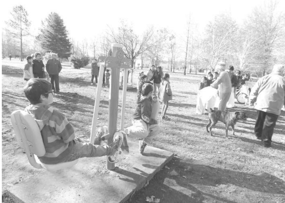
La CEyS celebró el Día de la Cooperación con la inauguración de los nuevos juegos.

entidad y sus miembros por este ejemplo para toda la comunidad", agregó. Finalmente, el jefe comunal; junto al titular cooperativo y el presidente del HCD, procedieron a efectuar el