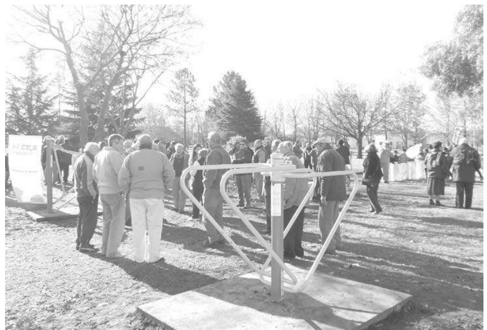
Modernos equipos y juegos de gimnasia incorporados en la plaza de Ciudad Nueva.

Con motivo de conmemorarse el primer sábado del mes de julio el Día Internacional de la Cooperación, la Cooperativa Eléctrica y de Servicios "Mariano Moreno", celebró esta jornada con la inauguración de un circuito de juegos saludables en la Plaza de la Cooperación, ubicada en calles Almafuerte y Paso de Ciudad Nueva, próxima al Centro de Atención Primaria de la Salud, Dr. Norman Moscato, acto que tuvo lugar a las 15 hs. de la referida jornada. El nuevo espacio abarca siete juegos saludables que se agregan a los ya existentes en este lugar del paseo público, que fuera