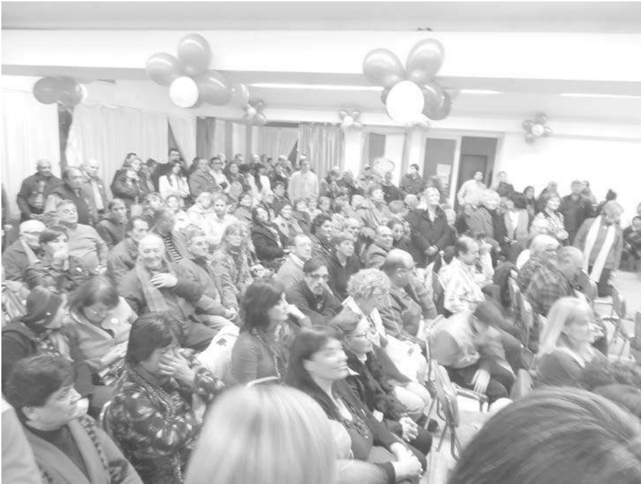
En el salón Abuelo Julio se realizó el acto de lanzamiento.