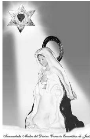
Comandante Madre del Divino Corazón Eucarístico de Jesús

Salida: Jueves 30 de julio. Regreso: Lunes 3 de agosto. Informes en 9 de Julio Tel: 021317-520182, 02317-523171. Cel: 02317-15-403278. Email: peregrinacionsui-pacha@hotmail.com. Cel: 02324-15-693442