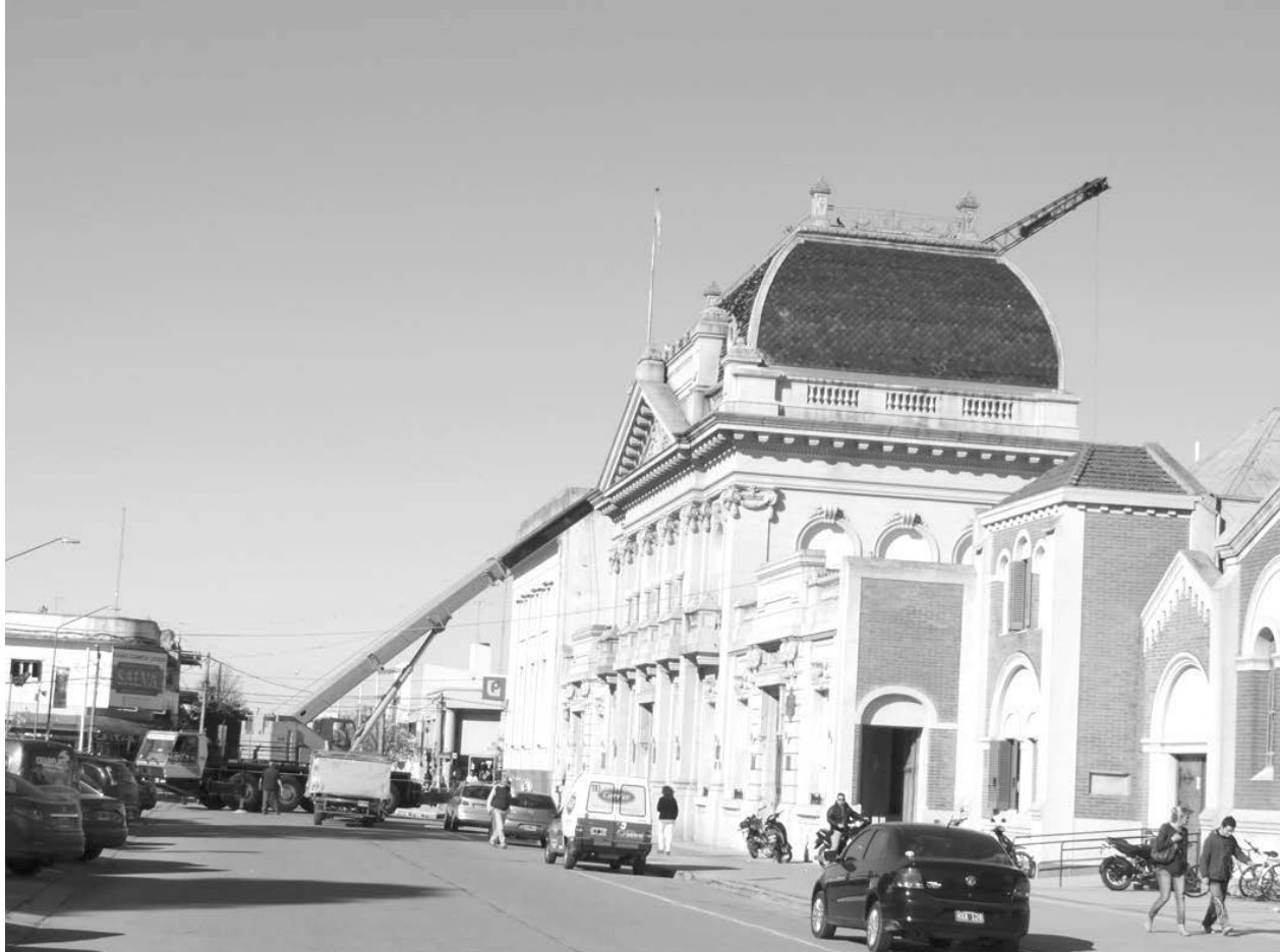
Muchos vecinos se vieron sorprendidos por la "gigante" grúa que trabajó en Banco Provincia. Foto De Sogos.