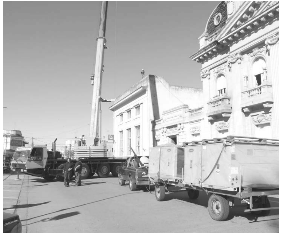
Equipos de frío/calor que fueron colocados en las instalaciones del Banco.

La utilización de la grúa fue indispensable para el retiro de los viejos equipos como para la instalación de los nuevos, en el sector del techo de la sucursal, desde donde además se efectuó el retiro de escombros, lo que determinó también el cercado de un amplio perímetro, a fin de evitar accidentes. Más allá de esta situación, la atención en las ventanillas fue absolutamente normal, más allá de alguna aglomeración de curiosos en horas de la mañana.