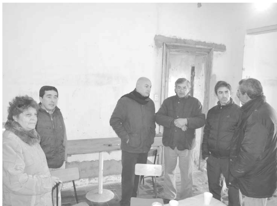
Integrantes del Centro de Jubilados de Patricios agradecieron el aporte recibido.

Cabe destacar que se trata de un aporte no reintegrable que fue gestionado por el concejal a través del candidato a Gobernador por el Frente Para la Victoria, Julián Domínguez.