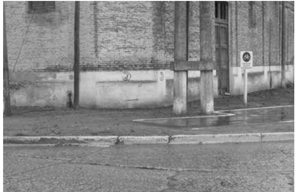
Vista de la vereda de Fournier y Alte. Brown.

VISTO: El estado caótico en que se encuentra el acceso Alte. Brown y una bicisenda inconclusa;