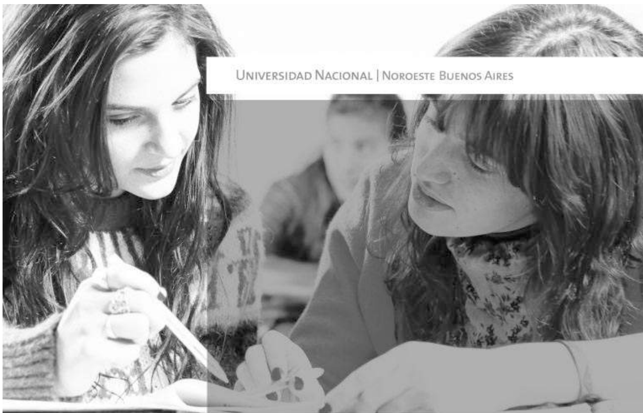
UNIVERSIDAD NACIONAL | NOROESTE BUENOS AIRES

"El amor multiplica, el amor es capaz de transformar por dentro y por fuera. Entonces, la invitación a compartir y a multiplicar es una invitación a vivir la compasión y a vivir el amor", agregó Monseñor Ojea.