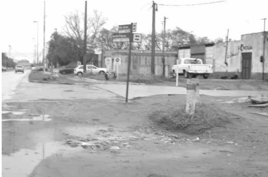
Elocuente imagen del acceso Alte. Brown donde finaliza la bicisenda.