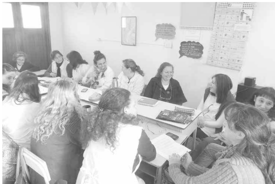
La Feria del Libro se desarrollará en setiembre.