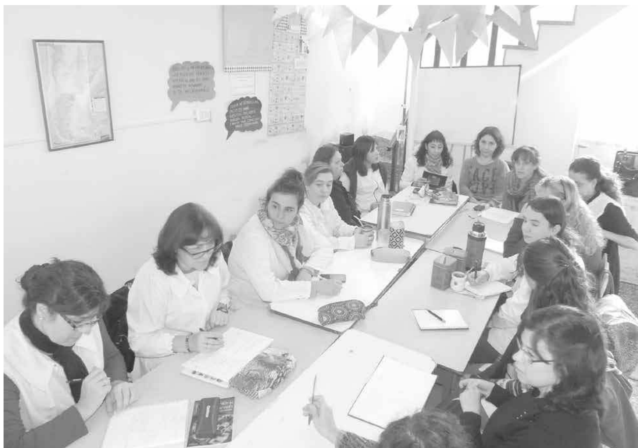
Docentes, bibliotecarias e inspectoras reunidas en el CIE.

En este calendario la misma se asocia a otro importante acontecimiento como es la "Semana de la Lectura", que se habrá de desarrollar en todo el ámbito bonaerense a través del Instituto Cultural y el Ministerio de Educación, entre el 8 y 12 de junio. Inf. en Pág. 4.