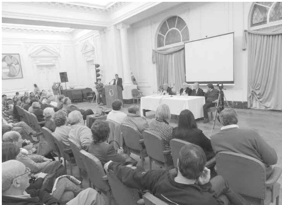
Vista de la reunión realizada en el Salón Blanco municipal.

Se construiría de manera paralela a Ruta Nacional 5 entre los accesos a Patricios y 9 de Julio, y en una primera etapa aportaría 2 megavatios y posteriormente, con una ampliación, otros 10.