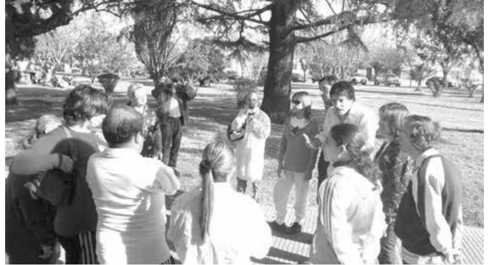
Integrantes del taller compartieron la jornada cultural en Quiroga.

La Dirección de Discapacidad agradece el recibimiento de todo Quiroga y su participación y acompañamiento.