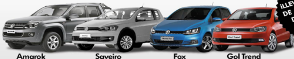
Amarok Saveiro Fox Gol Trend

BENEFICIOS EXCLUSIVOS: VENTAS CORPORATIVAS / IMPORTANTES DESCUENTOS FACTURACIÓN DIRECTA DE FÁBRICA