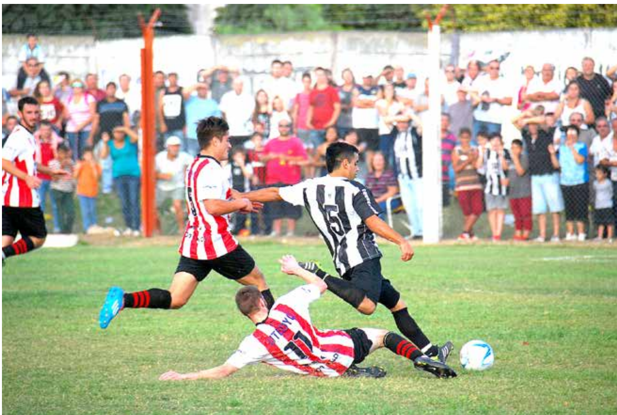
Con un partido de buen fútbol que terminó sin goles, el "Millo" mantiene el invicto.

En una jornada con 3 empates, solamente Once Tigres y San Agustín -que ahora quedó a 4 unidades- fueron los ganadores de la fecha - El árbitro informó que Quiroga - Libertad estaría "suspendido" por la discusión generada tras un penal a favor del Violeta. Inf. en Págs. 10 a 13.