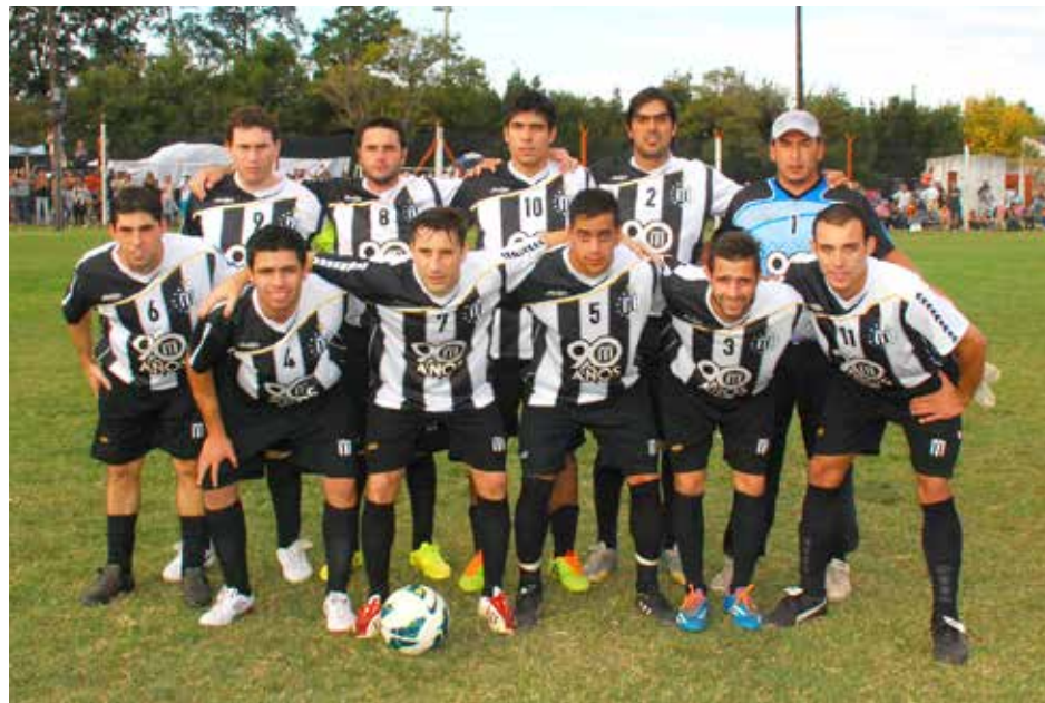
El Albinegro logró un importante empate de visitante.