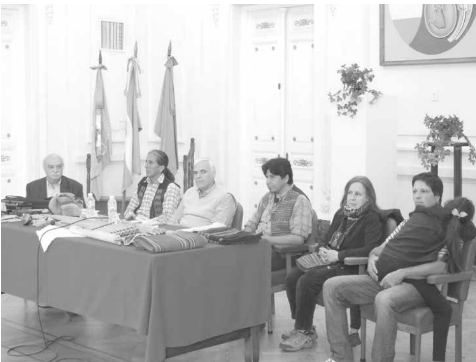
Autoridades municipales y aborígenes presidieron la jornada.

nio es muy valioso para que podamos transmitirlo a nuestros niños, a través de los docentes, cuyo compromiso y participación le agradecemos".