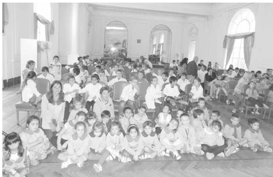
Alumnos de niveles inicial y primario, asistieron a la jornada aborigen.