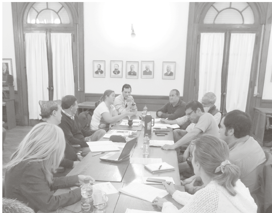
Sin la presencia de funcionarios municipales se realizó la reunión en el HCD.

Por otra parte el edil indicó que se dialogó sobre la ne-