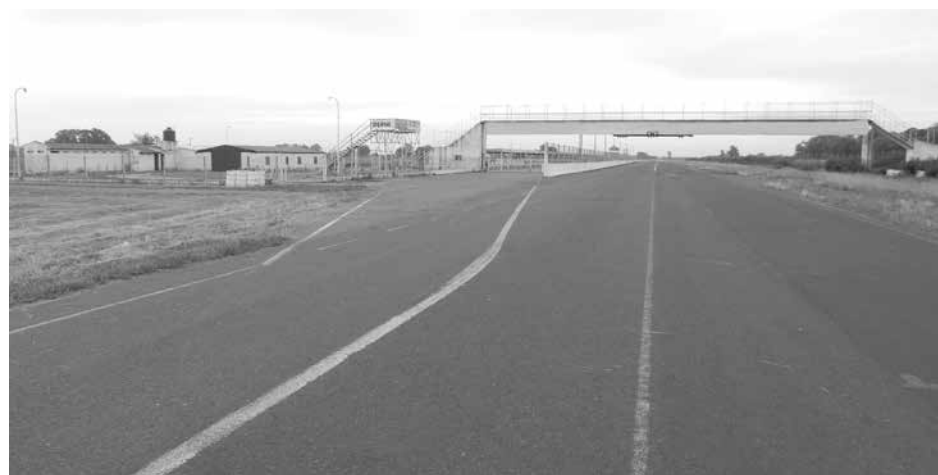
Finalmente, 9 de Julio volverá a tener su autódromo en marcha.

“Hoy sabemos de empresas que están esperando esto para acompañar, celebró.