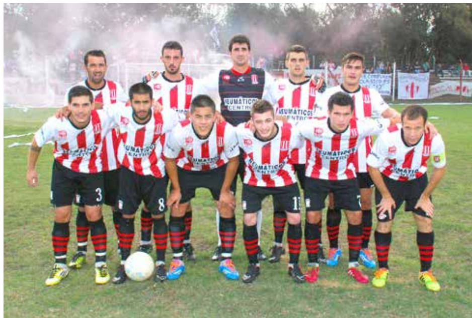
Plantel de Atlético 9 de Julio que continúa puntero invicto.

También tuvo resultado cerrado en cero la incursión de Libertad -que sigue sin sumar de a 3- a tierras quiroguenses, y ante un Violeta que poco a poco quiere recuperarse, aunque de acuerdo al informe del árbitro el encuentro estaría "suspendido" ante la polémica desatada por un penal en