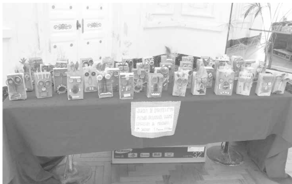
Trabajos de manualidad realizados por alumnos de 3ra. Sección del Jardín 913.

invitación y marcó su satisfacción por "poder trans-