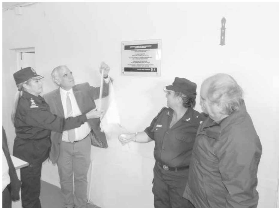
El Intendente junto al Ministro y personal policial femenino, descubren una placa.

Tras entonarse las estrofas del Himno Nacional Argentino, acompañadas por la Agrupación Sinfónica de la Policía de la Provincia de Buenos Aires y darse un to-