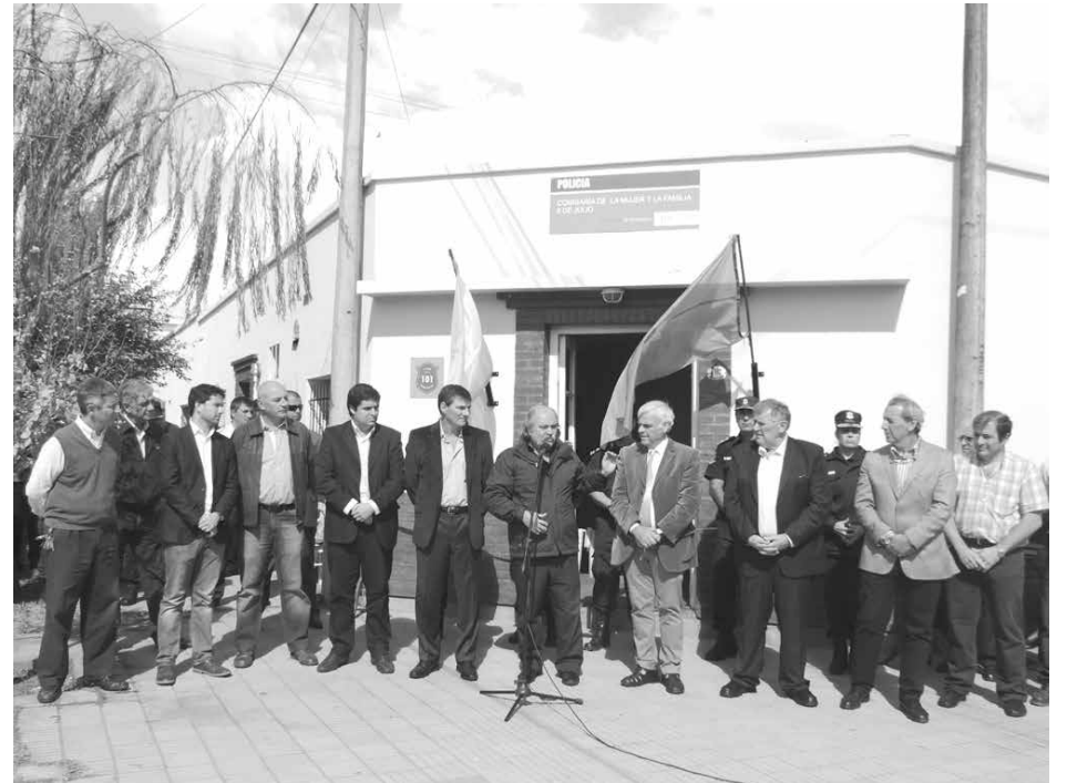
El Ministro Granados se dirige a los presentes.