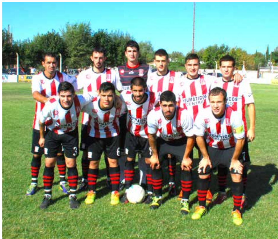
Atlético 9 de Julio.