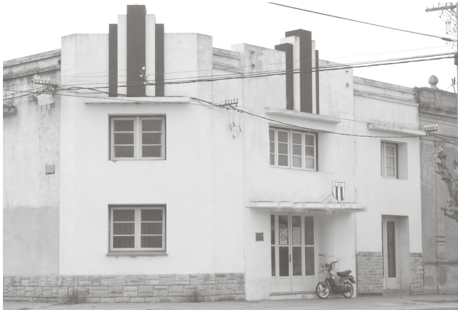
El Club Atlético French celebra hoy sus 90 años.