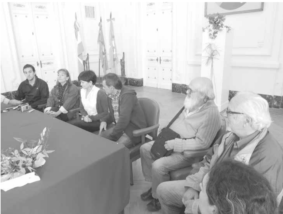
En conferencia de prensa, las autoridades explicaron el nuevo proyecto.

"El secado de los alimentos se hace desde el origen de la alimentación y es fundamental para su conservación", agregó la especialista, remarcando la importancia de que esta tecnología "sea avalada por los mismos huerteros y el CEPT, lo que le entrega una especial valoración".