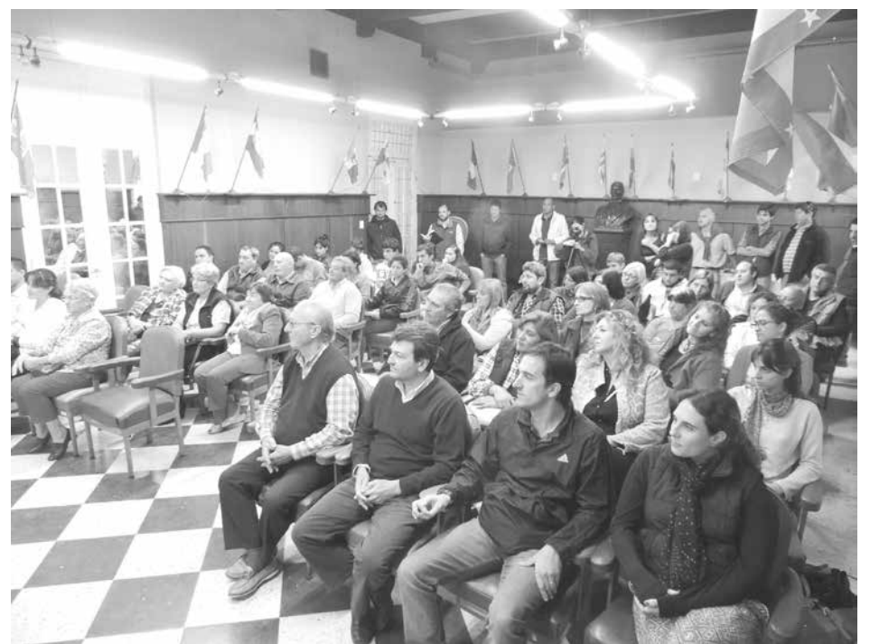
Asistentes a la presentación de la deshidratadora, ayer en el Salón de las Américas.

En diálogo con nuestro medio previo al acto, la directo-