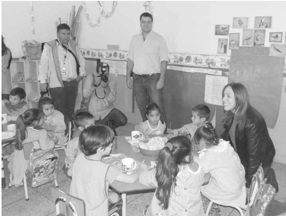
María Eugenia Vidal en visita al Jardín Nro. 910.