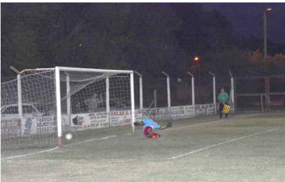
Leandro Díaz convierte su penal.