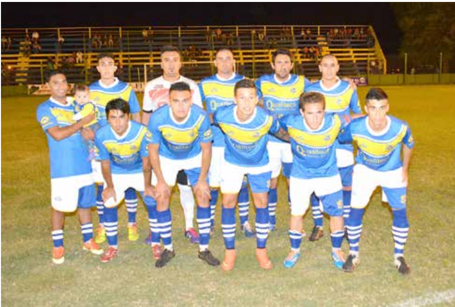
Once Tigres tuvo un pálido debut.