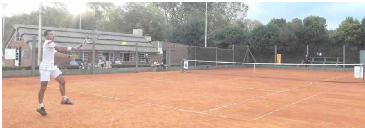
Tarantino en pleno juego.