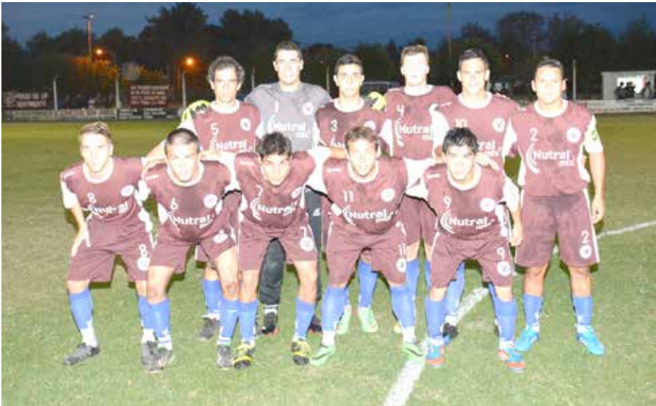
San Agustín no pudo aprovechar la temprana diferencia.