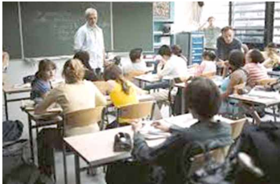
El Ciclo Lectivo se pone en marcha pese a los conflictos gremiales.

Petrocini, si bien reconoció que la oferta llevará el sueldo inicial de bolsillo desde los 5.000 pesos de diciembre a los 7.000 en