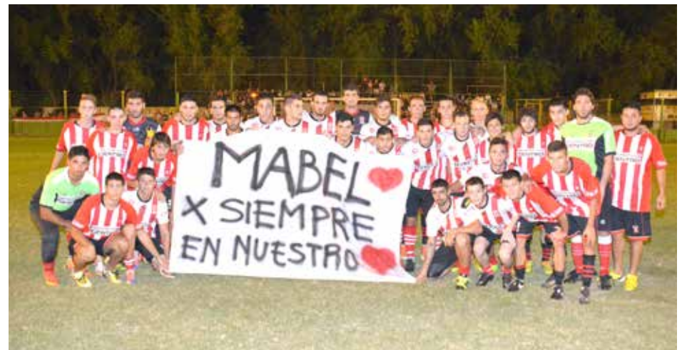
Equipo de Atlético 9 de Julio.