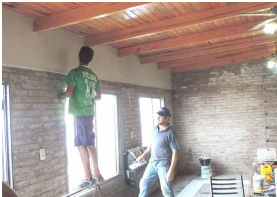
Trabajos que se realizan en la sede de la entidad.

“Estamos realizando obras importantes en nuestra sede, transmitiendo radio y también reactivando faros, actividad que se realiza todos los años en la última semana de febrero y en el mes de agosto, comunicando a todos los faros de la costa atlántica de nuestro país, de otros limítrofes y algunos de Latinoamérica, trazándose un concurso por suma de puntos por conexiones”, delineó el dirigente al destacar que la entidad local tuvo una activa participación en esta instancia, visitándose