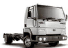
C 915 E

Cuotas fijas y en pesos. Aplicable a toda la línea cargo (**)