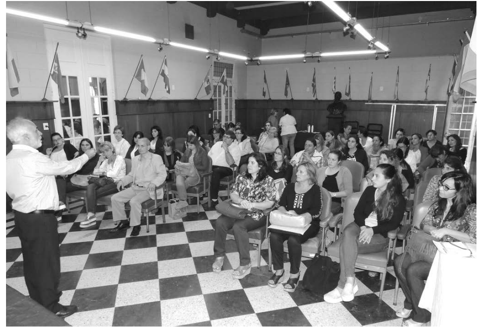
La jornada se desarrolló en el Salón de las Américas.

nizaciones vinculadas con la discapacidad, personas con discapacidad y familiares. “Esta fue una actualización con respecto a mi última visita y en esta oportunidad se encontraban presentes personas que integran el COMUDIS, muchos profesionales así como también funcionarios como el Subsecretario de Niñez, la Secretaria de Salud, la de Desarrollo y la Directora de Discapacidad y esto fue muy bueno”, destacó Fiamberti, en un break de su disertación. En el mismo sentido indicó que dicha actualización “surge después de la sanción de la Convención en el año 2008 en función de algunos avances como la Ley Nacional de Salud Mental, el nuevo Código Civil y la creación de algunos organismos, y siempre trabajando desde el concepto que plantea la Convención de modificar los contextos que tienen que ver con el modelo social y sobre el ejercicio igualitario del derecho de las personas con discapacidad, donde se deben generar todos los mecanismos y dispositivos para que un sujeto con discapa-