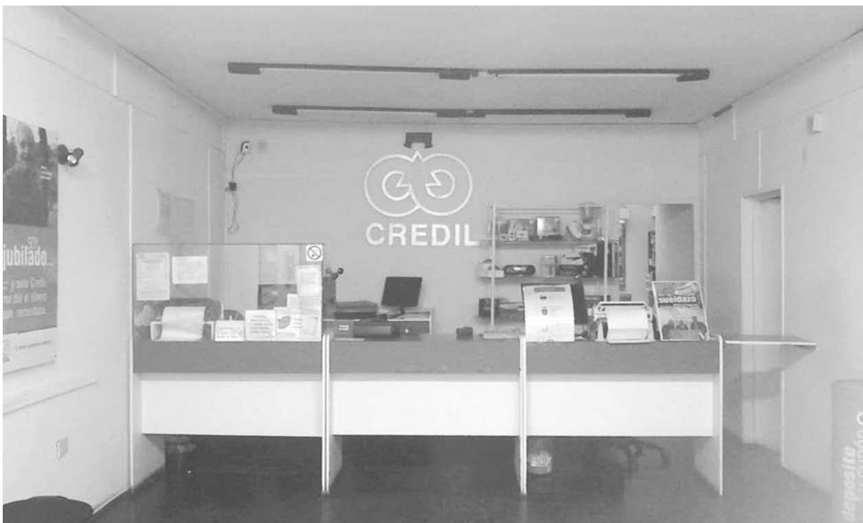
La firma CREDIL fue blanco de los delincuentes sin importar horario o lugar.

De acuerdo a testimonios recogidos en la oportunidad, dos individuos de sexo masculino actuaron a cara descubierta y exhibiendo un arma de fuego, exigieron dinero a las empleadas de la oficina, logrando alzarse con una suma de aproximadamente entre 3.000 y 3.500 pesos. Inf. en Pág. 3.